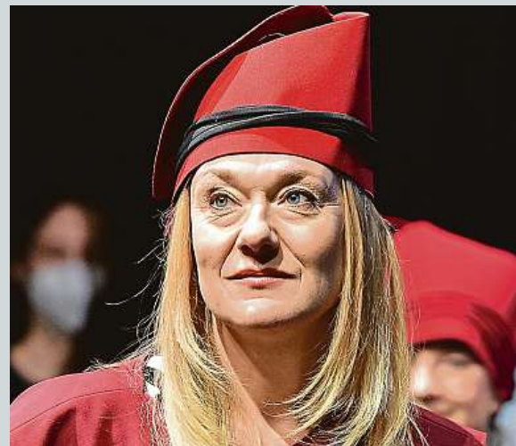
Pěvkyně Magdalena Kožená