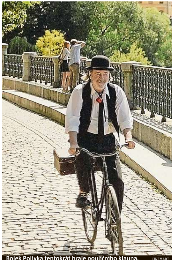
Bolek Polívka tentokrát hraje pouličního klauna.