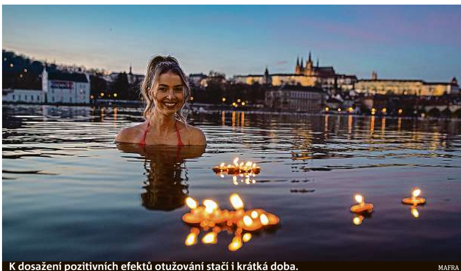
K dosažení pozitivních efektů otužování stačí i krátká doba.