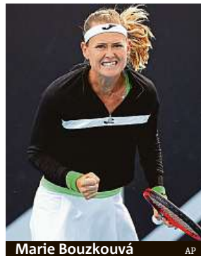
Marie Bouzková

Na Australian Open uspěli Macháč, Vondroušová a Bouzková.