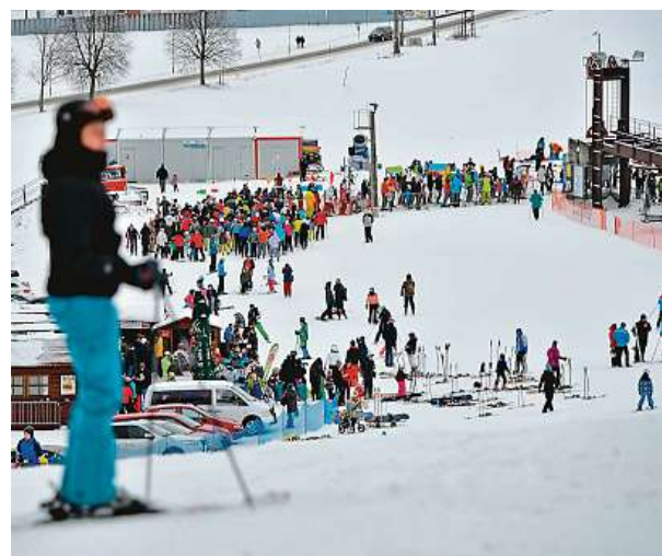
Ve skiareálu Harusák si na své přijdou sjezdaři.