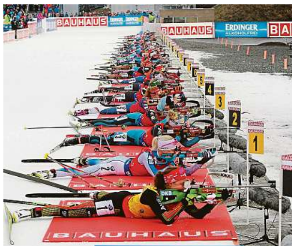
Vysočina Arena tradičně hostí závody SP v biatlonu.