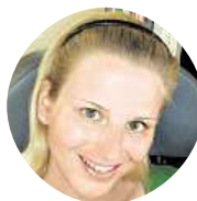
Mishka Jaramišů Já myslela, že chuťu je na hlídání a aby dohlédla na učení.