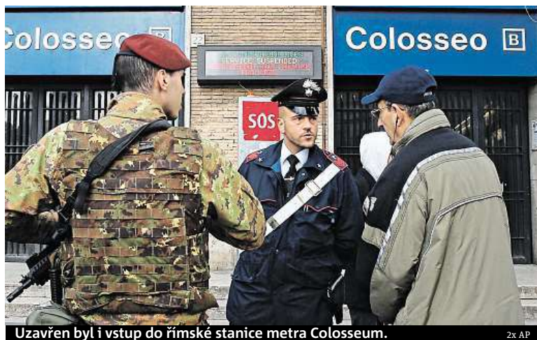
Uzavřen byl i vstup do římské stanice metra Colosseum.