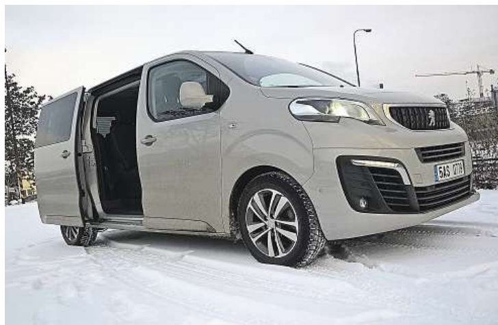
Peugeot stvořil hezkou dodávku, předek autu vyložené sekne.