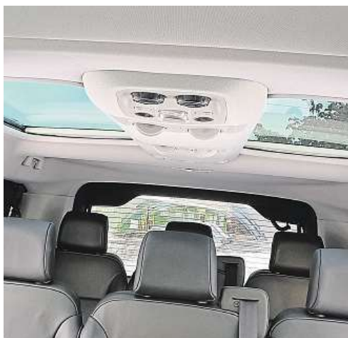
Díky oknu ve střeše je v autě světlo.