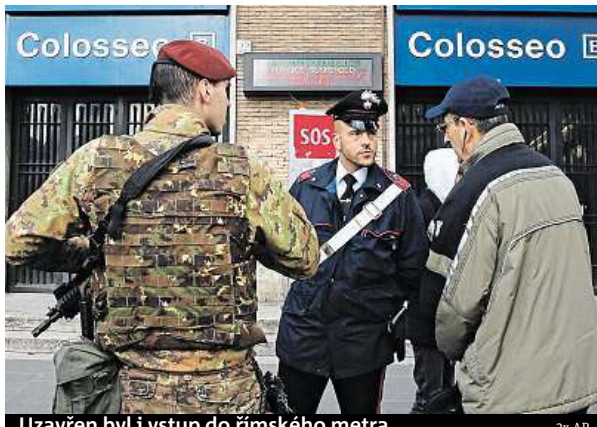
Uzavřen byl i vstup do římského metra.