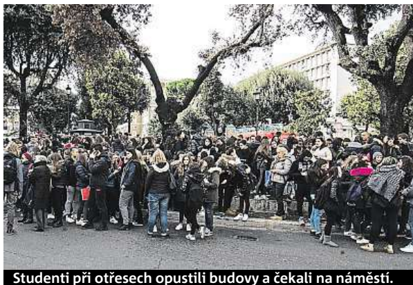
Studenti při otřesech opustili budovy a čekali na náměstí.