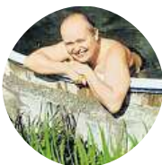
Richardson Mlynařík Někdy by potřebovali místo chuťu policajta.