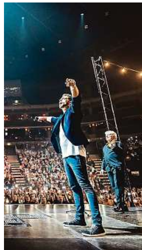
Skupina Jelen zve pro změnu na turné po divadlech. KLAPPER.CZ

„Připravujeme akustičtější podobu našich songů a vybíráme i písně, které jsme dlouho nehráli. Chceme ukázat jinou tvář Jelena, než jakou lidé znají z našich velkých koncertů, a zapojit diváky, aby se aktivně účastnili dění. Ladíme i finální podobu vystoupení, už teď ale víme, že