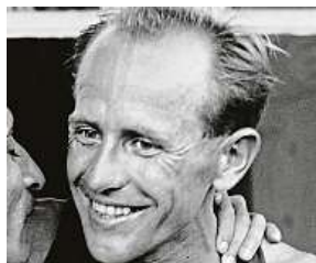
Emil Zátopek. Finové jeho příjmení slyší jako „satu pekka“.

ku Nokia (původně papírnku založenou v 19. století) nebo Molotovův koktejl, byl Carl Gustav Emil Mannerheim, vrchní velitel a prezident, který ještě ve svých dvaasedmdesáti letech velel zemi v zimní válce (1939 až 1940), kdy se Sovětský svaz pokusil navrátit Finsko do svého područí.