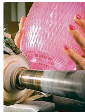
Zájemci mají šanci podívat se sklářům nebo dekoratérům pod ruce. Sklárny pro ně chystají řadu akcí.