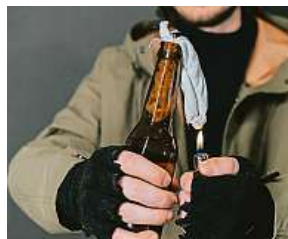
Molotovův koktejl vynalezli Finové během zimní války.

Svár maličků Finové vyhrát nemohli (více v infoboxu). Zároveň se jejich statečný a úporný odpor stal základem poválečné finlandizace. Šlo o to, že Finové mohli setrvat v bloku západních zemí