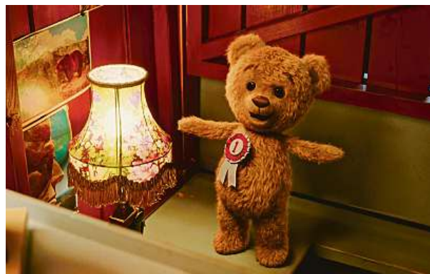
Pod norským rodinným filmem Médovy Vánoce je podepsána režisérka Andrea Eckerbomová.

Mimochodem, téma medvěda není pochopitelně v kinematografii pro děti nic nového. Budou znát například Medvídko Pú, Médu Beđu nebo medvídko Paddingtona. Spoustu fanoušků mají také animáky Kung Fu Panda nebo seriály Méda a Lumíci či Máša a Medvěd. A v kinech jsou stále ještě domácí Mlsné medvědí příběhy: Na póll! MET