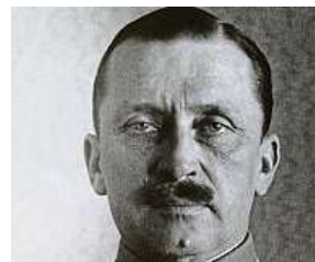
Carl G. Mannerheim. V Česku je obdobně ctěn T. G. Masaryk.

Finsko se postupně stalo zemí, kam se mohlo o něco snáze cestovat i z Československa; třeba hokejový trenér Augustin Bubník tu v 60. letech naučil hrát Finy, do té doby trpaslika, skutečně světový hokej. Za normalizace zase do Finska jezdily