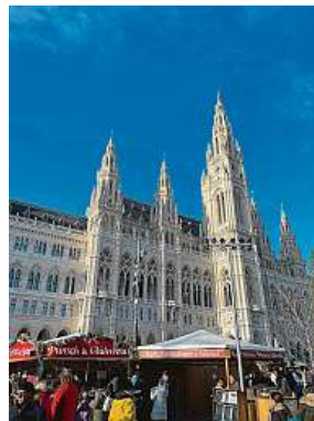
Trhy na Radničním náměstí ve Vídni zdobí panorama budovy.

Je kolem jedné hodiny odpoledne a místo se začíná hemžit lidmi. Většina stojí frontu na párky a klobásy v rohlíku. Cenově se pohybují kolem sedmi až deseti eur (171 až 245 korun). Záleží na kombinaci, kterou má kdo