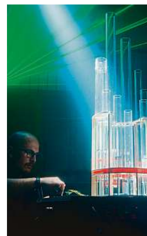
Fakulta elektrotechnická ČVUT vznikla již v roce 1950.