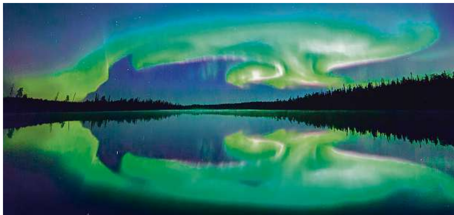
Polární záře se zrcadlí v jezeře poblíž Posia, které se nachází v nejsevernějším regionu země, v Laponsku. Tomuto mrazivému kraji vládnu sobové, jejichž počty zde převyšují lidskou populaci.

Prvním novodobým hrdinou země, která dala světu znač-