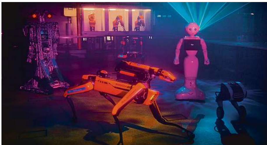
Zleva: Ludvík složený z lega, robopes SPOT, humanoid Pepper a balancující SK80. Tým výzkumníků a studentů tentokrát posílil také Akademický orchestr ČVUT a Pěvecký sbor ČVUT Praha.