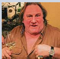
G. Depardieu