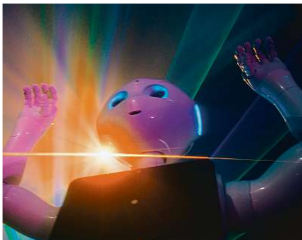
Letošní Vánoční video Fakulty elektrotechnické stává do popředí souhru výzkumníků a technologií generujících zvuky.