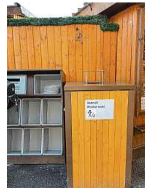
Ekologické opatření v podobě zálohovaných talířů 2x MET

rád. Tyto pokrmy sice dostanete do papírového sáčku, ale třeba plněné knedlíky či špízy obdržíte na klasický talíř. Rakouská metropole se tak snaží šetřit planetu. Po dojetí talíř odevzdáte na přistavený pult.