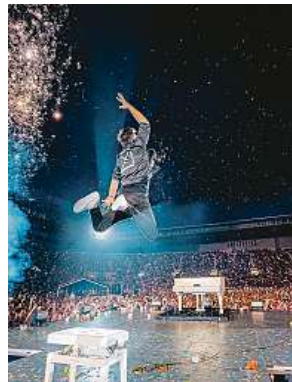
Technika koncertu pro Eden stojí čtyři miliony korun.

Přesně po půl roce, kdy se konal první ze tří vyprodaných koncertů Marka Ztraceného v Edenu, Voyo nabízí v exkluzivní premiéře dokument Marek Ztracený: Cesta do Edenu.