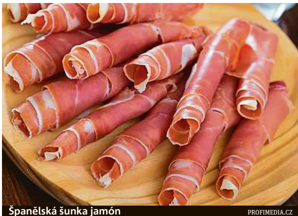
Španělská šunka jamón