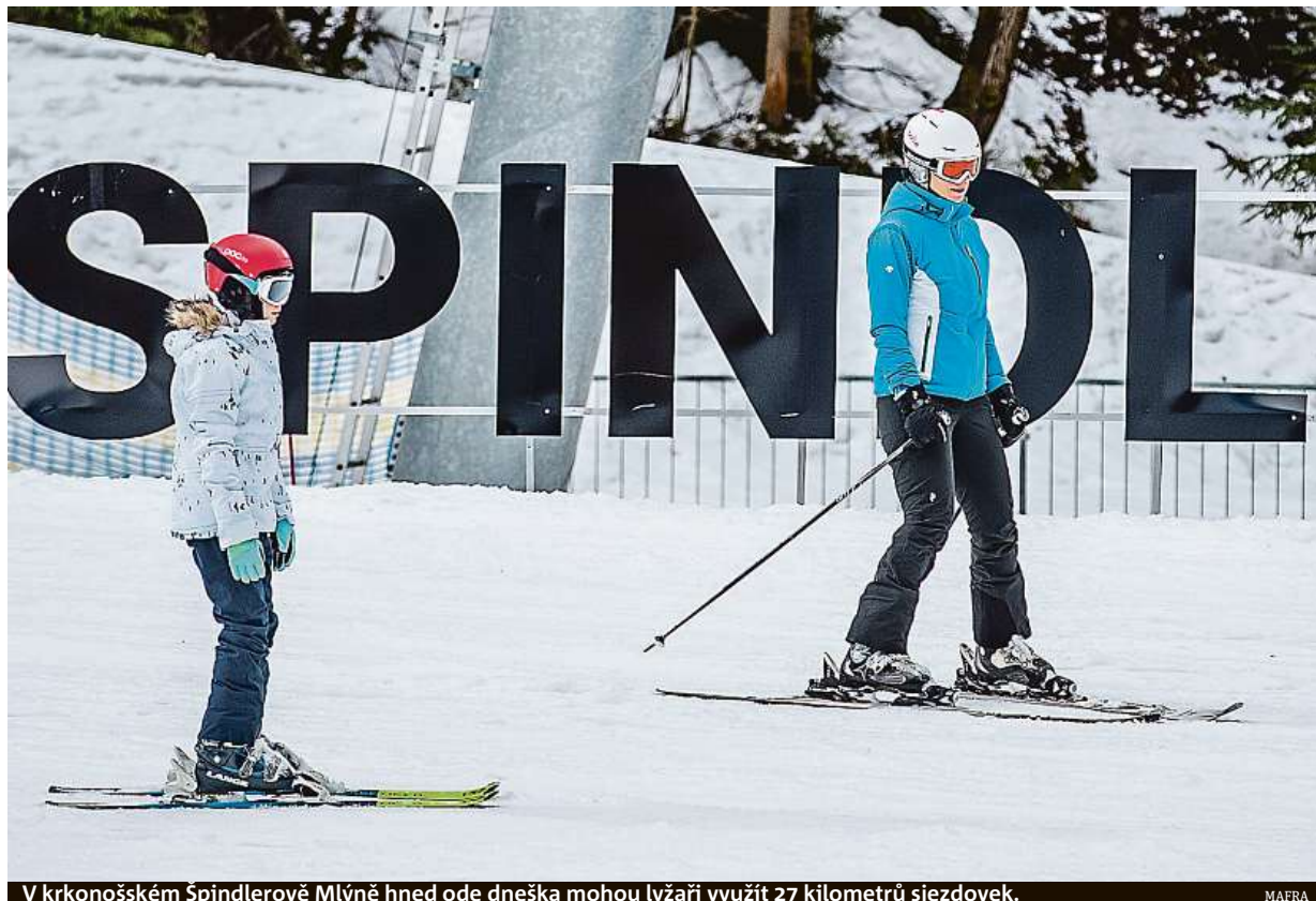
V krkonošském Špindlerově Mlýně hned ode dneška mohou lyžaři využít 27 kilometrů sjezdovek.