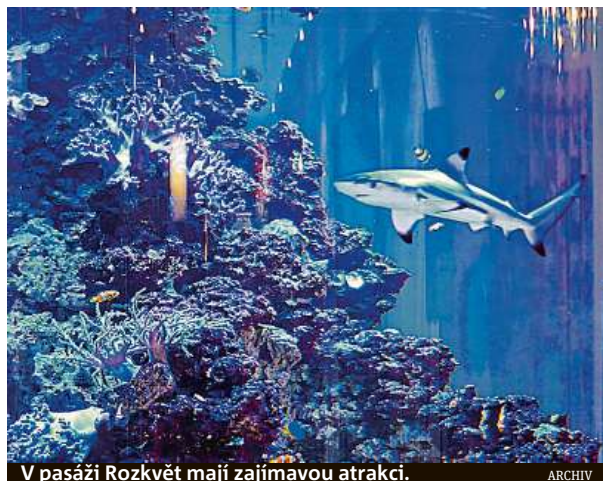
V pasáži Rozkvět mají zajímavou atrakci.