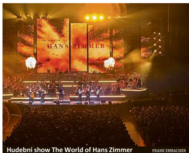
Hudební show The World of Hans Zimmer