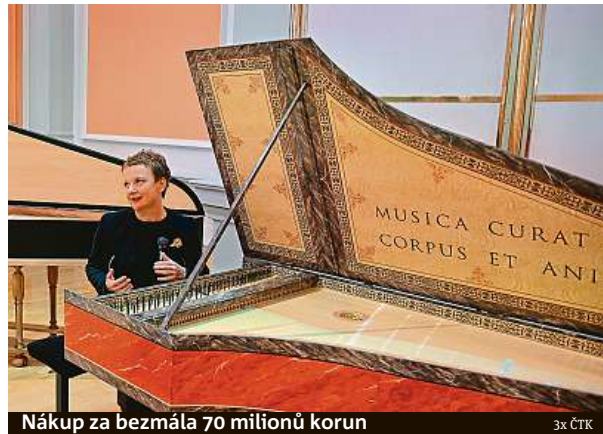
Nákup za bezmála 70 milionů korun