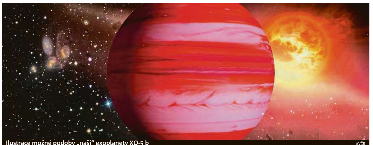
Ilustrace možné podoby „naší“ exoplanety XO-5 b

Návrhy na jména pro exoplanetu a hvězdu mohli lidé v Česku posílat od června do října. Do finále se probíjalo devět dvojic jmen. Pro pla-