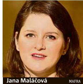
Jana Maláčová MAFRA

„Senátní verzi, kterou prosazují opoziční strany, však považuje ČSSD za spravedlivější,“ konstatovala Maláčová. Ta dále uvedla, že původně byly na stole čtyři verze: nenavýšit příspěvek vůbec, navýšit jej pro rodiče nově narozených