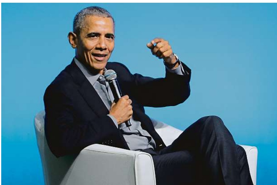
Někdejší prezident Spojených států Barack Obama na konferenci v Singapuru.

Obama uvedl, že v době, kdy byl hlavou státu, přemýšlel o tom, jak by vypadal svět, kdyby jej vedly ženy. „Ženy, jen chci, abyste věděly, že nejste dokonalé, ale mohou celkem bez pochybností říct, že jste lepší než my muži,“ řekl. „Pokud by dva roky každý stát na světě vedly ženy, jsem si zcela jist, že bychom více-