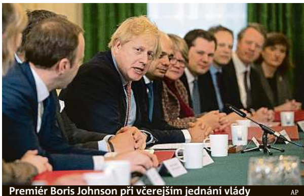
Premiér Boris Johnson při včerejším jednání vlády

O zákonu k brexitové dohodě by měli noví britští poslanci začít jednat už v pátek.