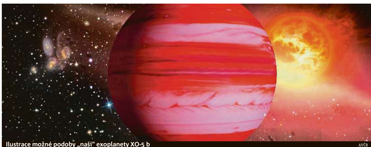
Ilustrace možné podoby „naší“ exoplanety XO-5 b

Návrhy na jména pro exoplanetu a hvězdu mohli lidé v Česku posílat od června do října. Do finále se probíjalo devět dvojic jmen. Pro pla-