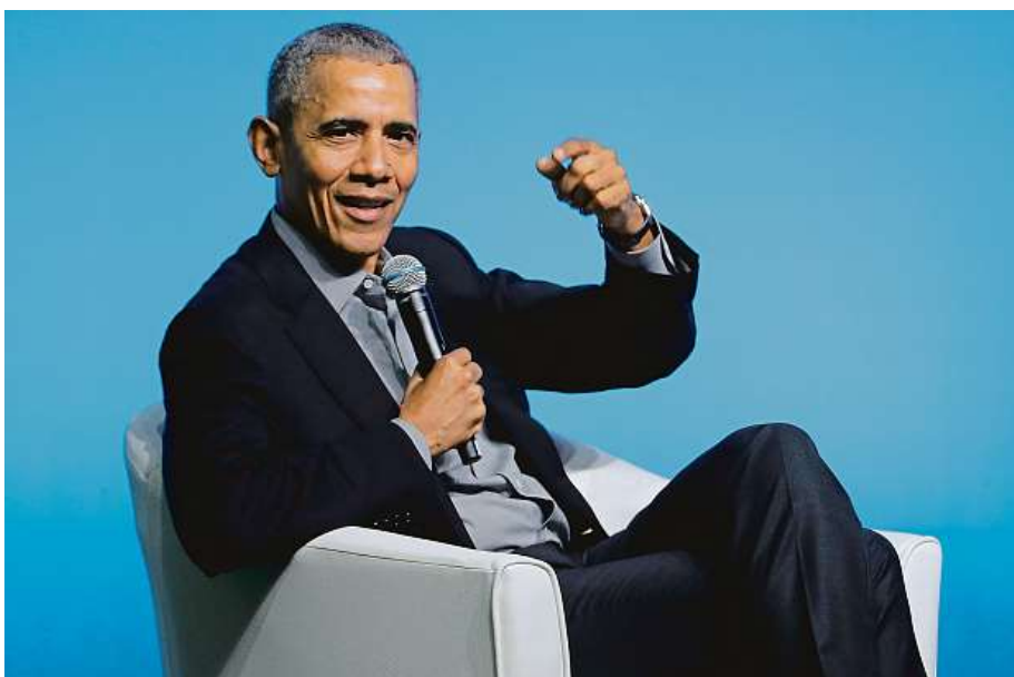
Někdejší prezident Spojených států Barack Obama na konferenci v Singapuru.

Exprezident USA poznamenal, že za problémy světa stojí většinou staří muži, kteří ze svých funkcí neodejdou.