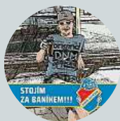
Antonín Řiho Byl jsem na diskotéce a tam jsem se cítil moc starý.