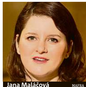
Jana Maláčová

„Senátní verzi, kterou prosazují opoziční strany, však považuje ČSSD za spravedlivější,“ konstatovala Maláčová. Ta dále uvedla, že původně byly na stole čtyři verze: nenavýšit příspěvek vůbec, navýšit jej pro rodiče nově narozených