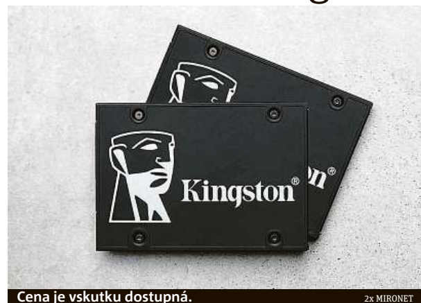
Cena je vskutku dostupná.

Kingston KC600 512 GB si můžete v Mironetu pořídit za 1640 korun. Disk lze pořídit také s kapacitou 1 TB. Disky s takovou kapacitou již nenajdou využití jen v počítačích, ale třeba i ve sdílených datových úložištích NAS. Kingston KC600 1 TB může být v Mironetu váš za 3129 korun.