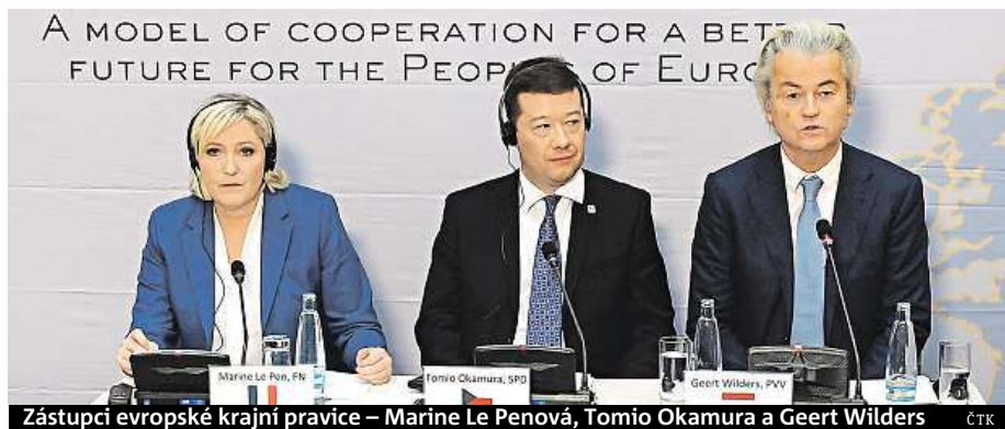
Zástupci evropské krajní pravice – Marine Le Penová, Tomio Okamura a Geert Wilders

EU je podle evropské krajní pravice u konce s dechem. Proti jejímu sjezdu protestovaly stovky lidí.