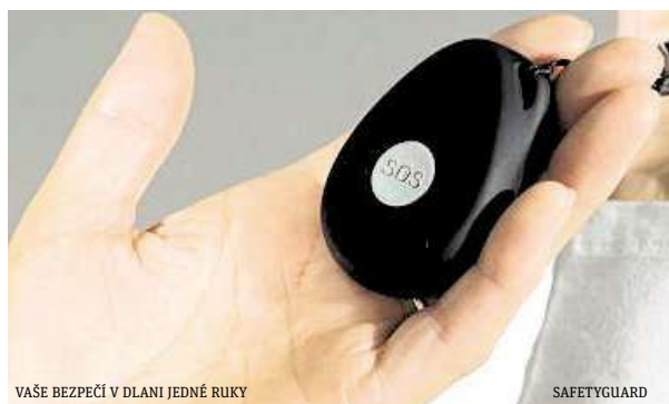
VAŠE BEZPEČÍ V DLANI JEDNÉ RUKY

Monitorovací centrum bdí nad svými uživateli nepřetržitě, čímž zajišťuje pomoc opravdu kdykoli. SOS Přívěsek je vybaven SIM kartou, což umožňuje snadnou komunikaci s uživateli přímo přes přívěsek. Navíc díky GPS lokátoru vás pomoc najde opravdu všude. Ať jste na nákupu, na návštěvě nebo v lese na houbách, Operátoři vždy přesně vědí, kam pomoc poslat.