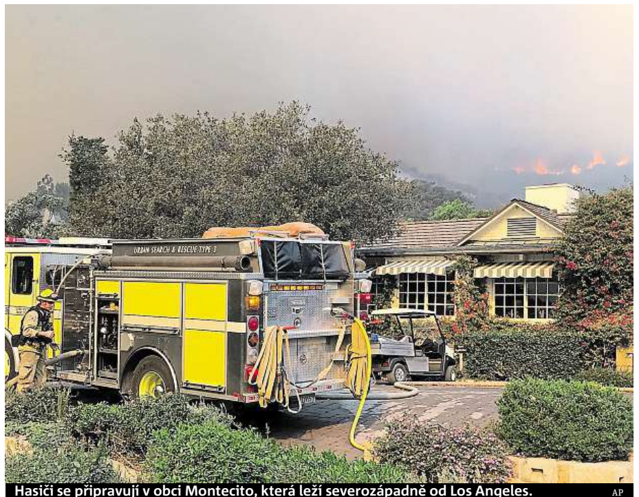
Hasiči se připravují v obci Montecito, která leží severozápadně od Los Angeles.

Požár Thomas je třetí nejrozsáhlejší v kalifornských dějinách. Zabírá území o téměř 1050 kilometrech čtverečních. Doposud zničil více než 700 domů. V terénu je 8144 hasičů, 1044 hasičských vozidel, 59 cisteren a 80 buldozerů. Velkou část hasičů tvoří vězni, kteří za práci dostávají dva dolary (44 korun) denně a dolar navíc za každou hodinu aktivního nasazení. MET, ČTK