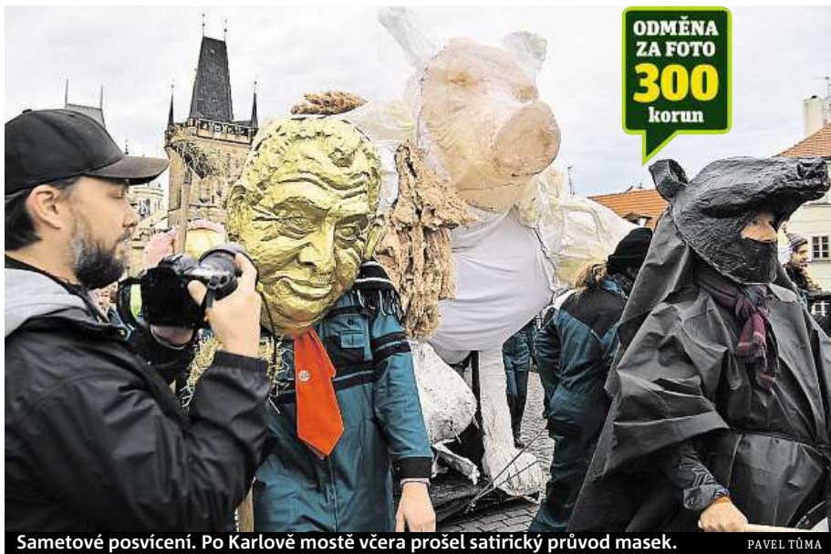
Sametové posvícení. Po Karlově mostě včera prošel satirický průvod masek.

V průběhu dne se pod heslem „Nezapomínáme! Připomínka boje za svobodu, protest proti populismu a politice prezidenta republiky“ jed-