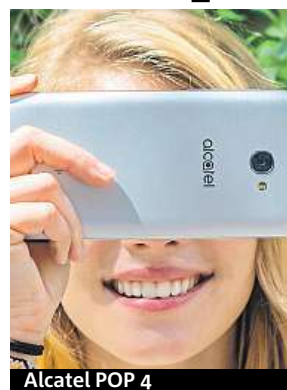
Alcatel POP 4

Příjemnou rychlost telefonu má zase na svědomí téměř čistý operační systém Android 6.0 v kombinaci s čtyřjádrovým procesorem a 1 GB ope-