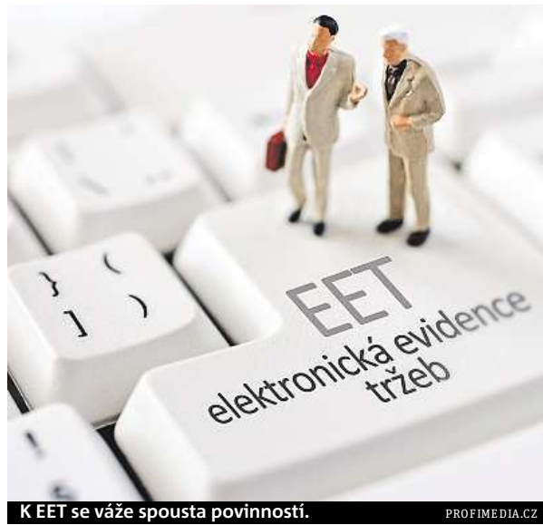
K EET se váže spousta povinností.