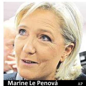
Marine Le Penová