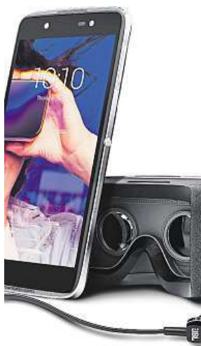
Alcatel IDOL 4 2x MIRONET

Alcatel o sobě dal před nedávnem opět pořádně vědět, když představil svou novou vlajkovou loď IDOL 4S, k níž rovnou připravil i menší alternativu Alcatel IDOL 4. Právě na menšího z obou kolegů se dnes zaměříme, a pokud jste doteď neměli jasno, jakým smartphonem nahradíte váš stávající mobil, po přečtení tohoto článku už byste mohli mít svého favorita. IDOL 4 se