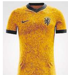
Dresy Nizozemska

Nizozemská reprezentace byla vždy známá typicky oranžovými dresy. Nyní ale přišla firma Nike s novou podobou, která sklízí kritiku. Třeba portál 101greatgoals.com napsal: „Nechápeme, jak se jim mohlo povést zruinovat tak ikonické dresy.“ PAVEL URBAN