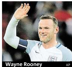
Wayne Rooney

Kapitán anglické reprezentace Wayne Rooney dovedl svůj tým k pátečnímu vítězství nad Skotskem 3:0, jenže lehce se zranil. To byl podle kouče Garetha Southgatea důvod, proč o čtyři dny později chyběl v přípravě proti Španělsku (2:2). Mezitím však bulvární deník The Sun zveřejnil fotografie, jak si Rooney užívá na svatbě včetně popíjení alkoholu. Za své chování už se ale omluvil. „Upřímně se omlouvám. I když to byl den, kdy měli všichni hráči volno, priznává, že takové fotky jsou nepříjemné pro někoho v jeho pozici,“ uvedli v prohlášení Rooneyho manažeři. Žádný trest mu ale nehrozí.