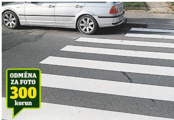
Nedomalovaný přechod baví okolí.