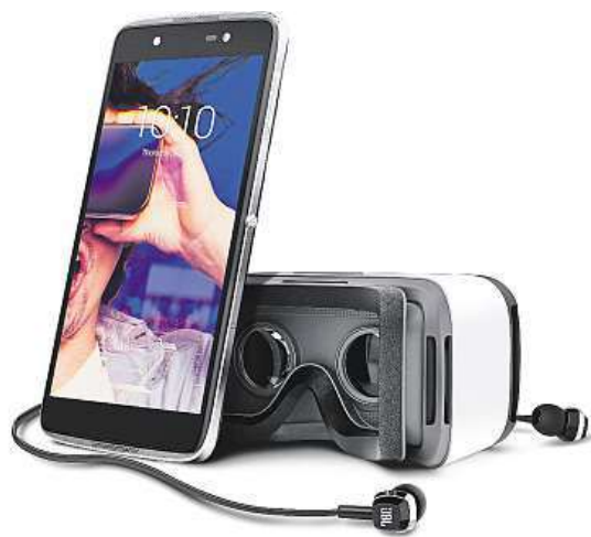
Alcatel IDOL 4

Alcatel o sobě dal před nedávnem opět pořádně vědět, když představil svou novou vlajkovou loď IDOL 4S, k níž rovnou připravil i menší alternativu Alcatel IDOL 4. Právě na menšího z obou kolegů se dnes zaměříme, a pokud jste doteď neměli jasno, jakým smartphonem nahradíte váš stávající mobil, po přečtení tohoto článku už byste mohli mít svého favorita. IDOL 4 se řadí ke špičce v takzvané