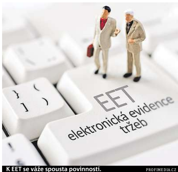
K EET se váže spousta povinností.