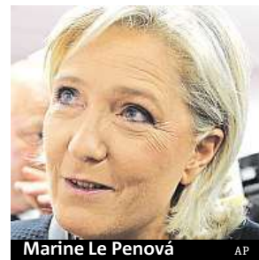
Marine Le Penová