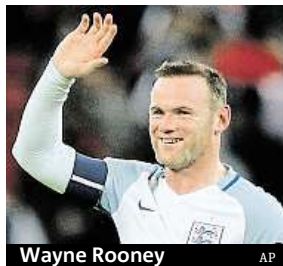
Wayne Rooney

Kapitán anglické reprezentace Wayne Rooney dovedl svůj tým k pátému vítězství nad Skotskem 3:0, jenže lehce se zranil. To byl podle kouče Garetha Southgatea důvod, proč o čtyři dny později chyběl v přípravě proti Španělsku (2:2). Mezitím však bulvární deník The Sun zveřejnil fotografie, jak si Rooney užívá na svatbě včetně popíjení alkoholu. Za své chování už se ale omluvil. „Uprímně se omlouvám. I když to byl den, kdy měli všichni hráči volno, přiznávám, že takové fotky jsou nepříjemné pro někoho z jeho pozice,“ uvedl v prohlášení Rooneyho manažer. Žádný trest mu ale nehrozí.