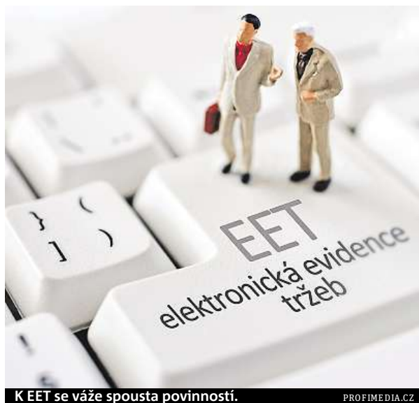
K EET se váže spousta povinností.