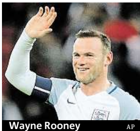
Wayne Rooney

Kapitán anglické reprezentace Wayne Rooney dovedl svůj tým k pátečnímu vítězství nad Skotskem 3:0, jenže lehce se zranil. To byl podle kouče Garetha Southgatea důvod, proč o čtyři dny později chyběl v přípravě proti Španělsku (2:2). Mezitím však bulvární deník The Sun zveřejnil fotografie, jak si Rooney užívá na svatbě včetně popíjení alkoholu. Za své chování už se ale omluvil. „Upřímně se omlouvám. I když to byl den, kdy měli všichni hráči volno, příznává, že takové fotky jsou nepříjemné pro někoho z jeho pozice,“ uvedl v prohlášení Rooneyho manažer. Žádný trest mu ale nehrozí.