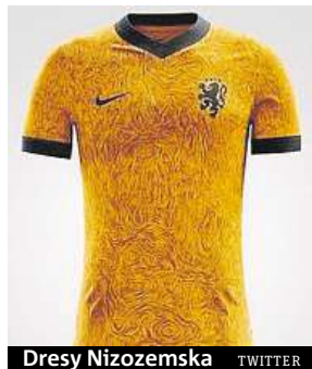
Dresy Nizozemska TWITTER

Nizozemská reprezentace byla vždy známá typicky oranžovými dresy. Nyní ale přišla firma Nike s novou podobou, která sklízí kritiku. Třeba portál 101greatgoals.com napsal: „Nechápeme, jak se jim mohlo povést zruinovat tak ikonické dresy.“ PAVEL URBAN