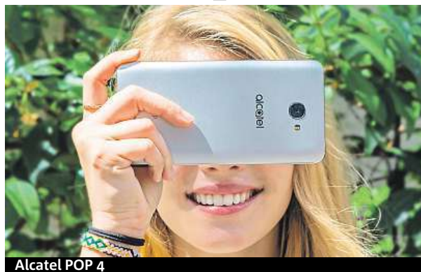
Alcatel POP 4

Příjemnou rychlost telefonu má zase na svědomí téměř čistý operační systém Android 6.0 v kombinaci s čtyřjádrovým procesorem a 1 GB ope-