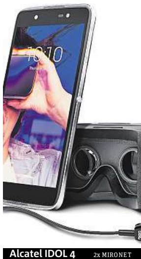
Alcatel IDOL 4 2x MIRONET

Alcatel o sobě dal před nedávnem opět pořádně vědět, když představil svou novou vlajkovou loď IDOL 4S, k níž rovnou připravil i menší alternativu Alcatel IDOL 4. Právě na menšího z obou kolegů se dnes zaměříme, a pokud jste doteď neměli jasno, jakým smartphonem nahradíte váš stávající mobil, po přečtení tohoto článku už byste mohli mít svého favorita. IDOL 4 se řadí ke špičce v takzvané