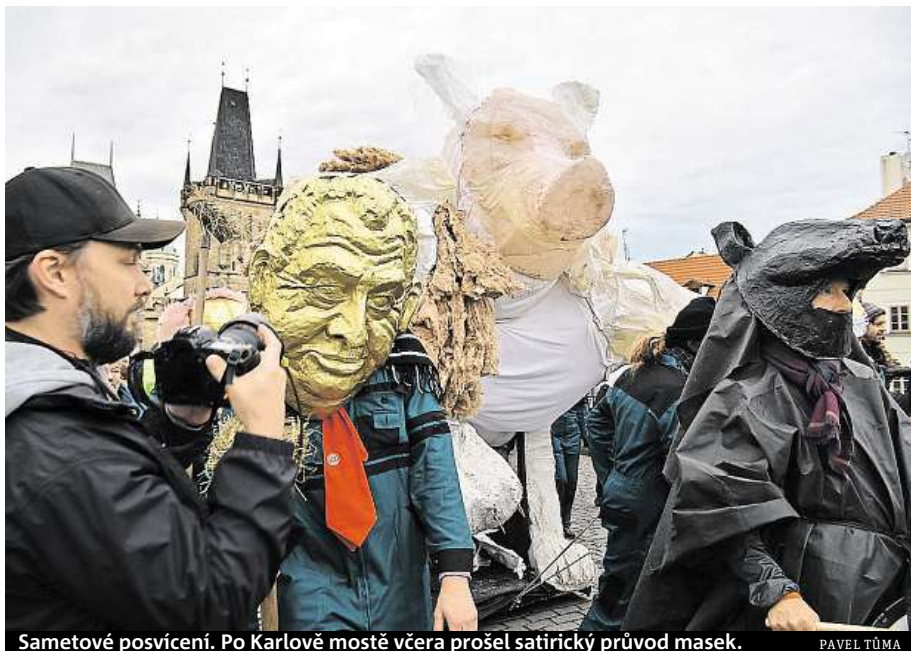
Sametové posvícení. Po Karlově mostě včera prošel satirický průvod masek.

V průběhu dne se pod heslem „Nezapomínáme! Připomínka boje za svobodu, protest proti populismu a politice prezidenta republiky“ jed-