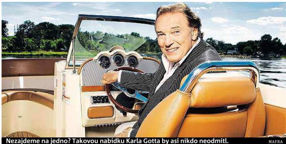
Nezajdeme na jedno? Takovou nabídku Karla Gotta by asi nikdo neodmítl.

Se zlatým hlasem z Prahy, jak se ikoně československé a české popové scény přezdívá, by lidé posedli raději než se sportovní legendou Jaromírem Jágrem. Na pivo by jej po-