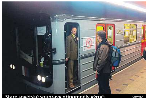
Staré sovětské soupravy připomněly výročí. METRO

Umakartový interiér, koženkové sedačky naproti sobě a tmavě červené lino na podlaze. Do toho znělka vybízející k urychlenému nástupu a výstupu, taktéž z dob minulých. Nostalgie z návratu do minulosti vykouzly na tváři nejednoho