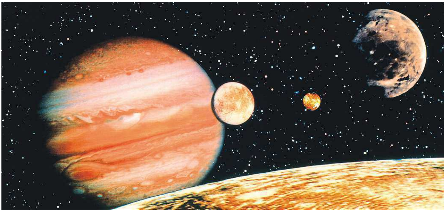
Jupiter and the Galilean moons seen from Callisto