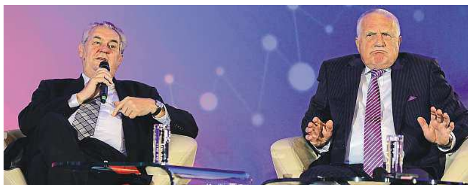
Miloš Zeman a Václav Klaus na sobotní konferenci 25 let kapitalismu v ČR