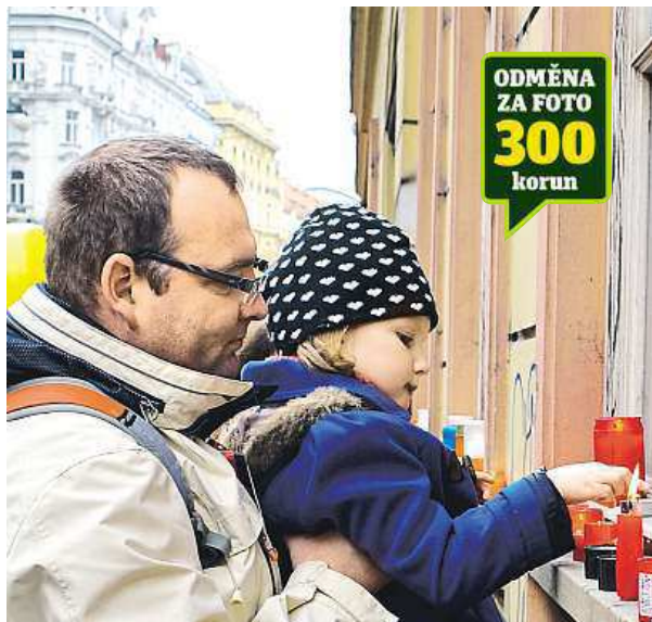
Na Národní třídu přišli také rodiče s dětmi. DAVID SEDLECKÝ