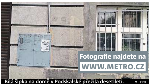
Bílá šipka na domě v Podskalské přežila desetiletí.

Šipky byly natřeny vápnem, a proto se velmi špatně odstraňují, na některých místech tak doslova prosvítají