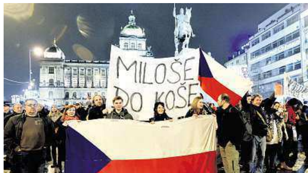
Znovu 89 – koncert na Václavském náměstí