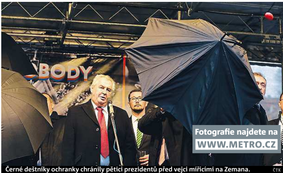
Černé deštníky ochranky chránily pěti prezidentů před vejci mířícími na Zemana.

Prezidenta na Albertově musela ochranka bránit před předměty létajícími z davu. Podle Hradu německého prezidenta Joachima Gaucka zasáhlo vajíčko do spánku. Německá ambasáda ale zprávu popře-