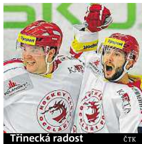
Třinecká radost