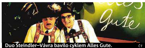
Duo Šteindler-Vávra bavilo cyklem Alles Gute.

železnice. V zadní projekci nechybí panoráma Pražského hradu a záběr na horu Říp. Po sametu nechce být ostrou politickou satirou. Švejkovským humorem popisuje dění uplynulých „svobodných“ let, tu a tam groteskně, jindy s vlnitou nostalgií. Je zkrátka odrazem povahy českých houbařů. MARCELA MAGDOVÁ