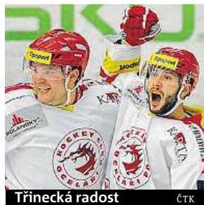
Třinecká radost

Extraliga. Do čela tabulky se vrátil Třinec