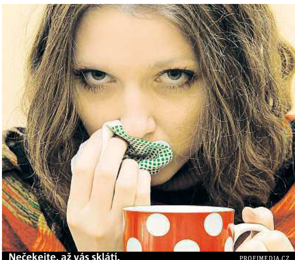
Nečekejte, až vás sklátí.

Běžná virová onemocnění horních dýchacích cest nemají tak těžký průběh jako například angína nebo zápal plic. Obvykle je doprovází teplota, bolesti hlavy, rýma, škrábání až bolest v krku a svalové či kloubní bolesti. Poté se objevuje kašel, zpočátku suchý, dráždivý, který posléze přejde ve vlhký s odkašláváním hlenu. Není to chřipka, tu vyvolávají specifické viry a do Česka přicházejí většinou až v zimních měsících. Projev má podobné, ale její nástup je rychlejší, objevují se velmi vysoké teploty a typický je su-