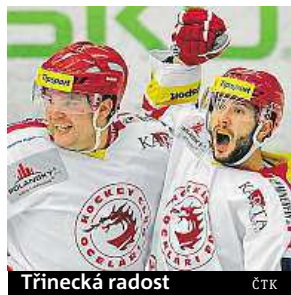
Třinecká radost

Extraliga. Do čela tabulky se vrátil Třinec