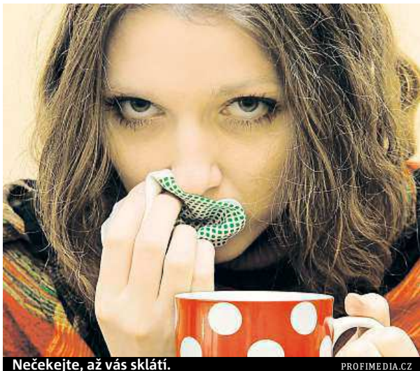
Nečekejte, až vás sklátí.

Běžná virová onemocnění horních dýchacích cest nemají tak těžký průběh jako například angína nebo zápal plic. Obvykle je doprovází teplota, bolesti hlavy, rýma, škrábání až bolest v krku a svalové či kloubní bolesti. Poté se objevuje kašel, zpočátku suchý, dráždivý, který posléze přejde ve vlhký s odkašláváním hlenu. Není to chřipka, tu vyvolávají specifické viry a do Česka přicházejí většinou až v zimních měsících. Projevy má podobné, ale její nástup je rychlejší, objevují se velmi vysoké teploty a typický je su-