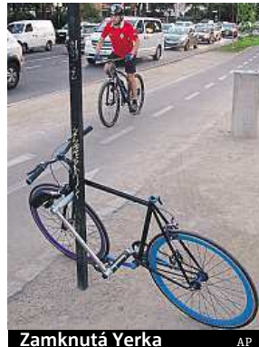
Zamknutá Yerka AP

Pokud by chtěl někdo jejich kolo ukrást, musí ho zničit, a je tak podle agentury AP naprosto zbytečné ho krást. Nejnovějším trendem jízdních kol je využít pro jejich uzamčení přímo některou z částí kola. Na trhu jsou již taková, jež používají pro zamčení sedlo nebo odnímatelná říditka. Vynálezci yerky tento způsob ještě vylepšili.