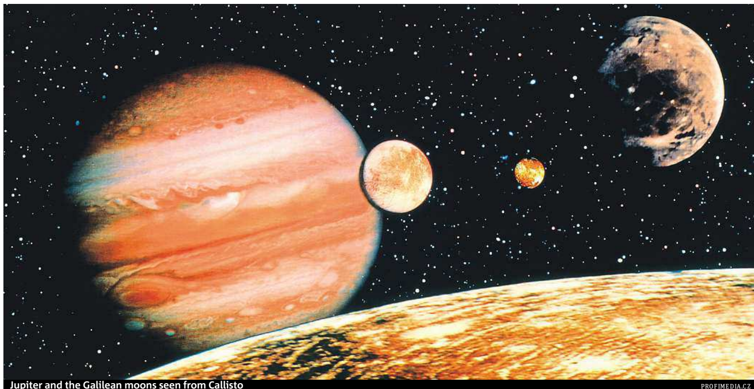
Jupiter and the Galilean moons seen from Callisto