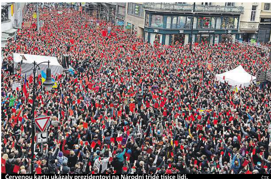
Červenou kartu ukázaly prezidentovi na Národní třídě tisíce lidí.