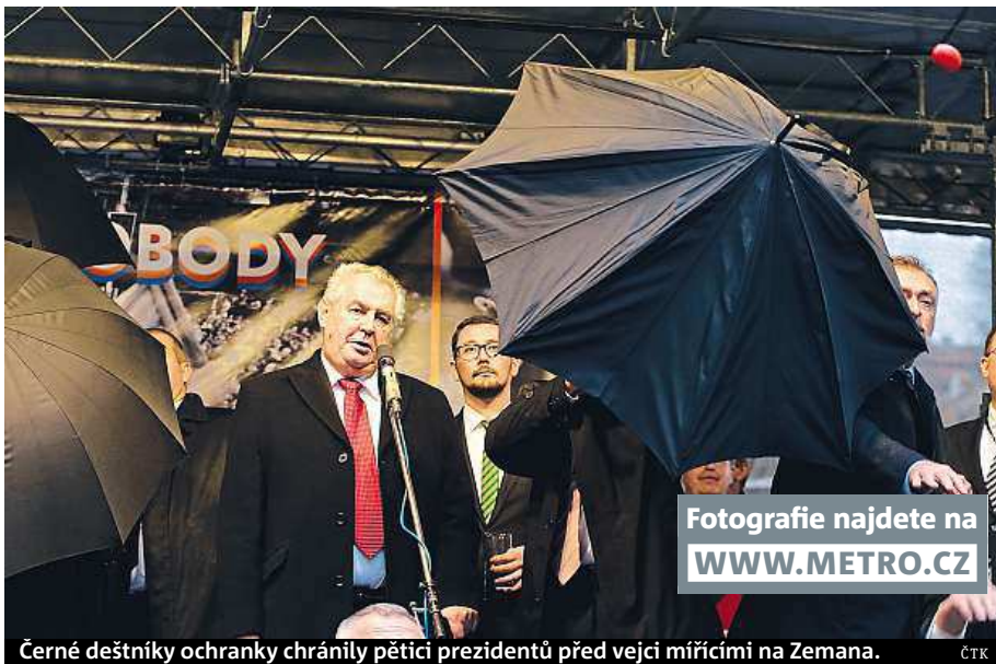
Černé deštníky ochranky chránily pětici prezidentů před vejci mířícími na Zemana.