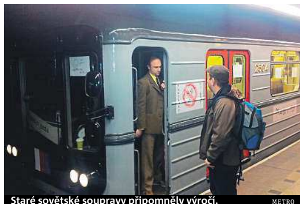
Staré sovětské soupravy připomněly výročí.