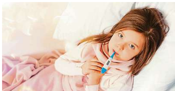
Cigaretový kouř má vliv na infekce dýchacích cest.

„Zásadní je také jeho kvalita. Zdravý spánek lze podpořit omezením obrazovek – tato zařízení by se měla vypínat alespoň hodinu nebo dvě