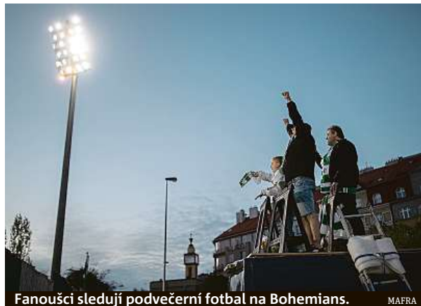
Fanoušci sledují podvečerní fotbal na Bohemians.

„I když samozřejmě počítáme, že bude vyšší než v předchozích letech. Do konce tohoto kalendářního roku máme ceny fixovány a nové ceny jsou teprve v jednání,“