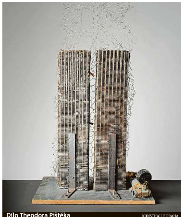
Dílo Theodora Pištěka