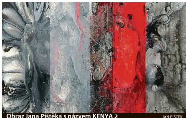
Obraz Jana Pištěka s názvem KENYA 2

Jan Pištěk představí svá díla pocházející především z období posledních pěti let, jež reflektují jeho zájem o přírodní a civilizační fenomény. Theodor Pištěk nabídne průřez svou tvorbou od nevystavených děl po své poslední počiny. MET