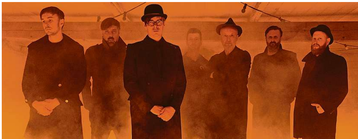
Kafka Band je hudebně-literární projekt z Prahy. Křest nového alba proběhne 1. listopadu v Paláci Akropolis.