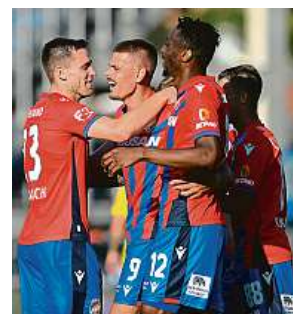
Fotbalisté Plzně se radují z jednoho ze sedmi gólů.

Sešivání v sezoně fotbalové ligy stále neprohráli, posedmé naplno bodovali.