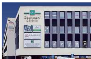
Obchodní galerie, Jihlava