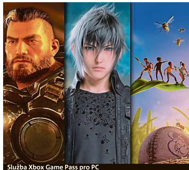
Služba Xbox Game Pass pro PC

Tuto službu si zatím mohli užívat pouze majitelé konzolí Xbox, nyní je ale dostupná i pro počítačové hráče. Microsoft tímto otevírá přístup k více než 100 úžasným hrám, mezi kterými si každý najde svého nového favorita. Dočkáte se klasických akcí z první i třetí osoby, mozek namáhajících strategií, závodních i sportovních simulátorů a mnoha dalšího.