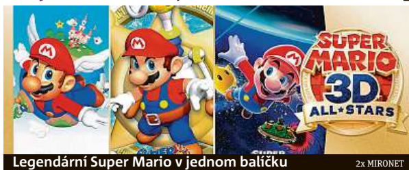
Legendární Super Mario v jednom balíčku

Nintendo je platformou, která má fanoušků takovýchto klasik miliony po celém světě, a také si to japonská firma náležitě uvědomuje. Proto nyní přichází se speciální