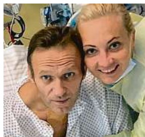
Navalnyj s manželkou AP

Kritik Kremlu minulý měsíc náhle onemocněl při vnitrostátním letu z Tomsku do Moskvy. Letoun musel nouzově přistát v Omsku, kde byl Navalnyj v bezvědomí hospitalizován a posléze přepraven zvláštním letem do Berlína, kde se zotavuje v nemocnici Charité. Hlavní oponent