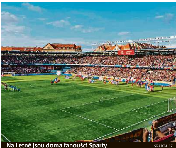
Na Letné jsou doma fanoušci Sparty.