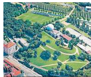
Návrh na řešení

hojně navštěvované místo s nezaměnitelným výhledem, sportovním zázemím a místem pro odpočinek.“ MET