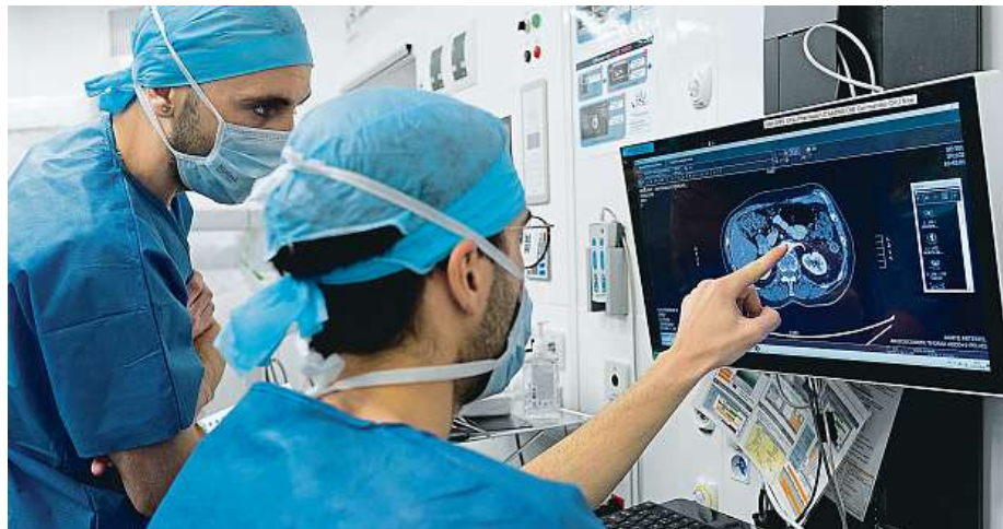
Při selhání ledvin je zapotřebí dialýza nebo transplantace.