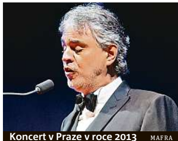
Koncert v Praze v roce 2013

„Kdyby bůh měl hlas, byl by to hlas Andrea Bocelliho,“ řekla zpěvačka Céline Dionová.