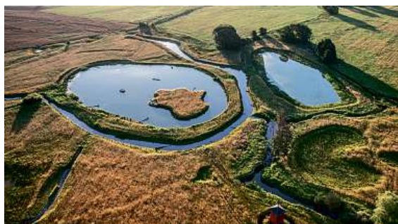
Přírodní lokalita s názvem Kozmické pačiči louky ve vlastnictví firmy Semix Pluso se stává ornitologickou perlou Slezska.

Připraveno ve spolupráci s otickou společností SEMIX PLUSO, prvním výrobcem skutečně celozrnných cereálií, pekařských a cukrářských směsí, BIO a bezlepkových produktů. Semix je zároveň největším zpracovatelem máku v ČR. Filozofií společnosti je vyrábět chutné a zároveň zdravé cereální produkty, nešetřit na kvalitě a být k zákazníkům fér.