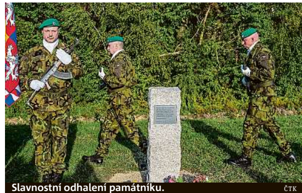
Slavnostní odhalení památníku.

Německé obyvatelstvo v pohraničí tehdy tvořilo výraznou většinu. Hlavní roli v nepokojích měla sudetoněmecká strana vedená Konradem Henleinem a jí vytvořený ozbrojený sbor Freikorps. Zárybnický nebyl jedinou českou obětí tehdejších událostí, jen padlých členů SOS bylo v regionu šest. Nejtragičtější bylo 23. září 1938. Po zákeřném útoku zemřeli tři lidé při přepadení celnice v Srbské u Frýdlantu. Týž den byl zavražděn i učitel Otakar Kodeš, po němž se jmenuje v Heřmanicích památná skála a kulturní dům. ČTK