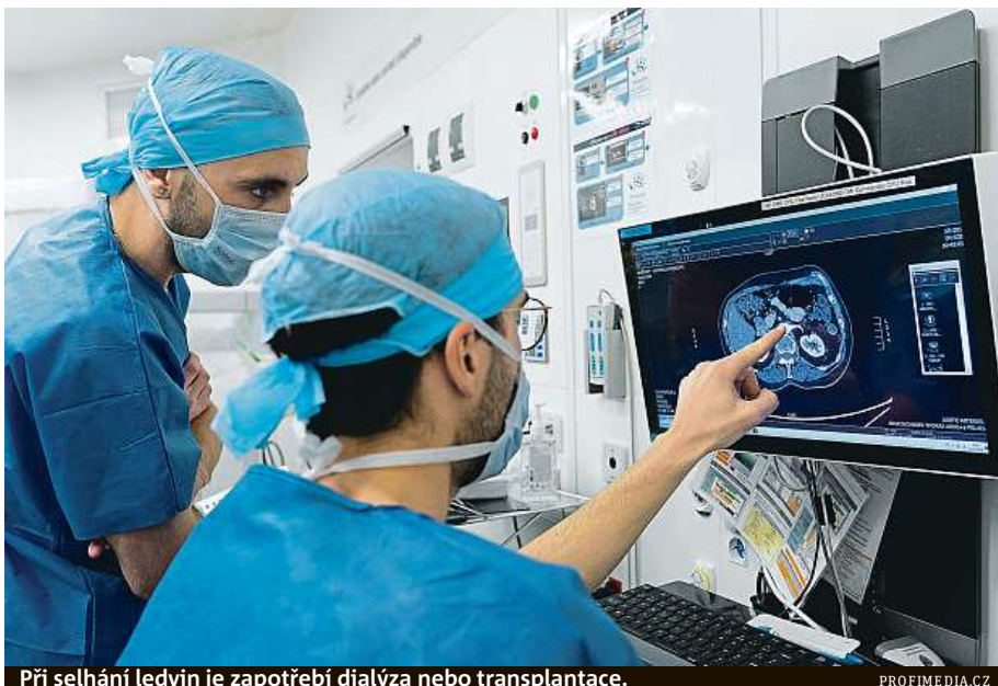
Při selhání ledvin je zapotřebí dialýza nebo transplantace.

V souvislosti s civilizačními nemocemi bývá často zmiňován srdeční infarkt nebo mozková mrtvice. Příčinou těchto příhod je poškození cév, které se vlivem tukových a vápenných usazenin zužují a tuhnou, a pak jimi proudí