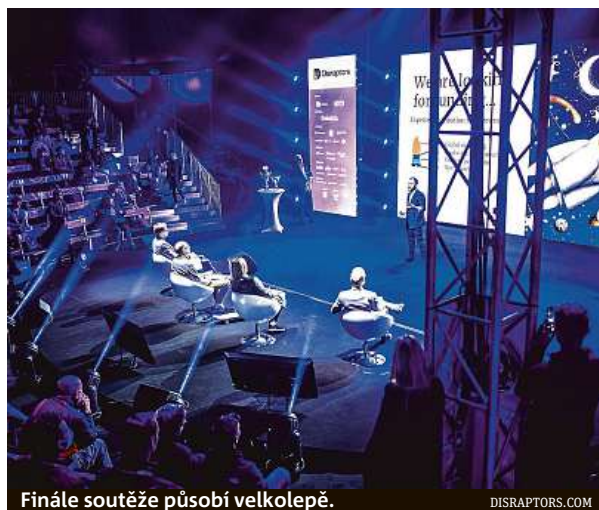
Finále soutěže působí velkolepě.

Ze stovek přihlášených projektů vyberou analytici desítku nejlepších, které se představí před porotou. Soutěž V4 se uskuteční v pondělí 10. října. Do úterního finále z ní po-