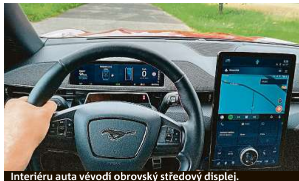
Interiéru auta vévodí obrovský středový displej.

Henry Ford, zakladatel americké automobilky, by jen koukal, co mu nyní sjíždí z liny. PETR HOLEČEK