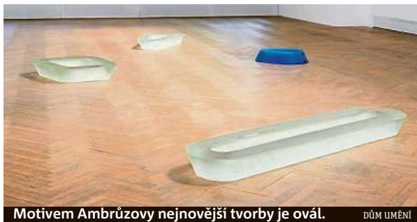
Motivem Ambrúzovy nejnovější tvorby je ovál. DŮM UMĚNÍ

Ambrúz se k veřejnému vystavování vrátil po delší odmlce a v nejnovějších dílech na-