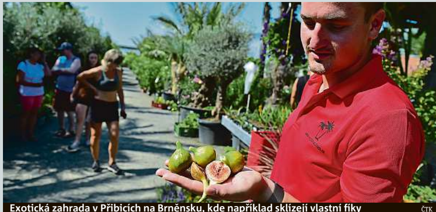
Exotická zahrada v Přibicích na Brněnsku, kde například sklízí vlastní fíky