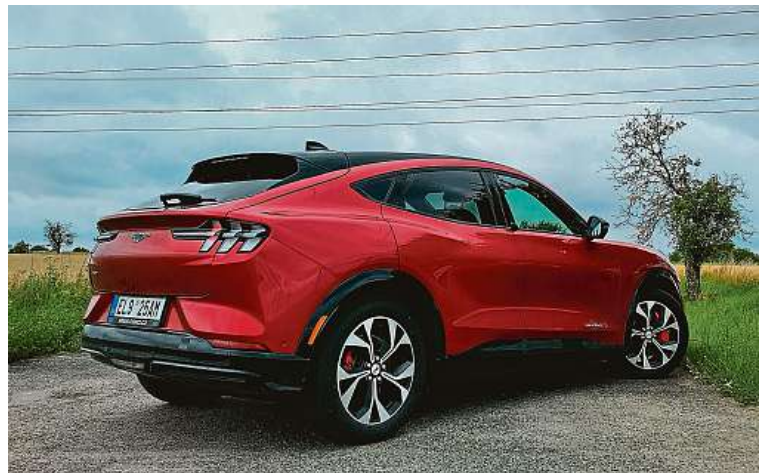
Kufř pojmě v základu přes 400 litrů, po složení sedadel až 1600.