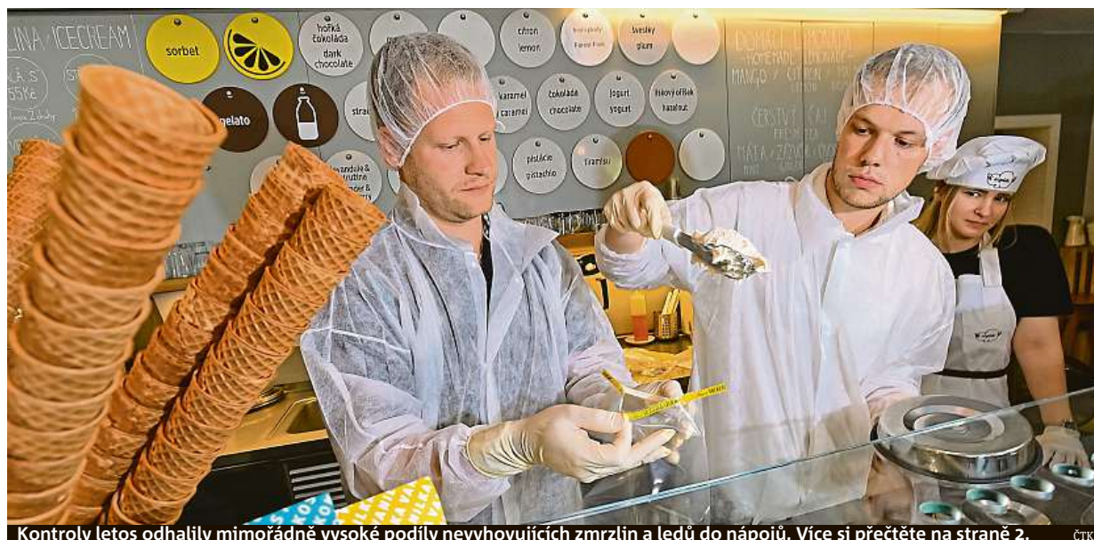
Kontroly letos odhalily mimořádně vysoké podíly nevyhovujících zmrzlin a ledů do nápojů. Více si přečtete na straně 2. ČTK

Sexting. Sdílení vlastních intimních snímků, videí či textů s erotickým obsahem. Nebezpečí. Nikdy nevíte, kdo si obrázek stáhne. Identifikace autora. Někdy vede i k vydírání. Prevence. Zodpovědnost rodičů STRANA 4