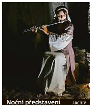
Noční představení ARCHIV

Každý čtvrtek se v rámci akce Kutnohorské léto konají činoherní noční procházky historickou Kutnou Horou.