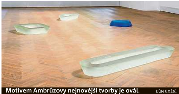
Motivem Ambrúzovy nejnovější tvorby je ovál. DŮM UMĚNÍ

Ambrúz se k veřejnému vystavování vrátil po delší odmlce a v nejnovějších dílech na-