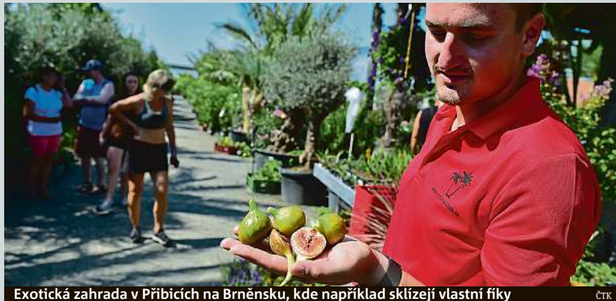
Exotická zahrada v Přibicích na Brněnsku, kde například sklízí vlastní fíky