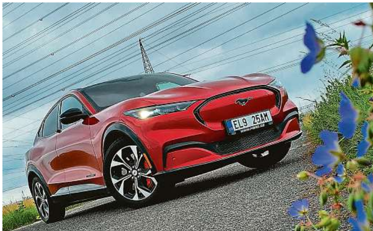
Sluší mu to, že? Uvnitř se ukrývají dva elektromotory a velká baterie.