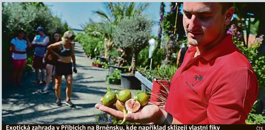
Exotická zahrada v Přibicích na Brněnsku, kde například sklízí vlastní fíky