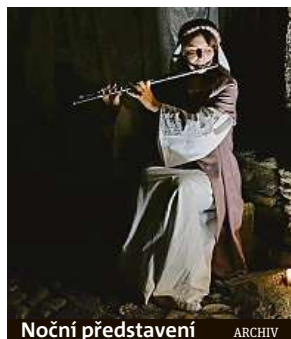
Noční představení ARCHIV

Každý čtvrtek se v rámci akce Kutnohorské léto konají činoherní noční procházky historickou Kutnou Horou.