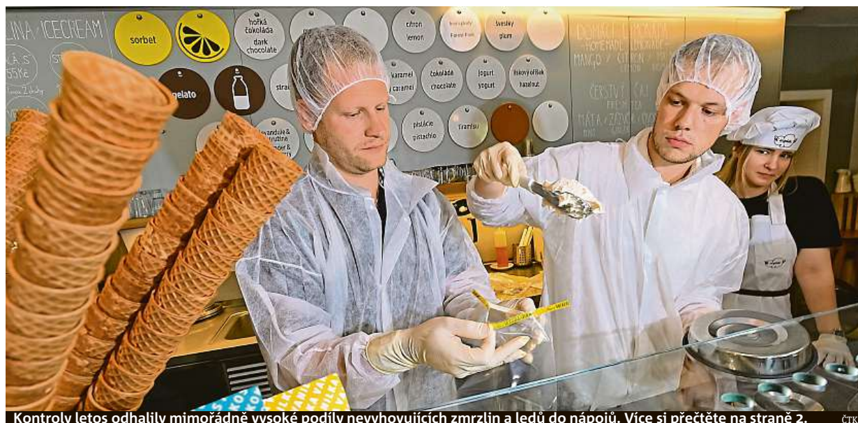
Kontroly letos odhalily mimořádně vysoké podíly nevyhovujících zmrzlin a ledů do nápojů. Více si přečtete na straně 2. ČTK

Sexting. Sdílení vlastních intimních snímků, videí či textů s erotickým obsahem. Nebezpečí. Nikdy nevíte, kdo si obrázek stáhne. Identifikace autora. Někdy vede i k vydírání. Prevence. Zodpovědnost rodičů STRANA 4