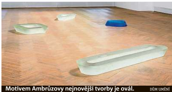
Motivem Ambrúzovy nejnovější tvorby je ovál. DŮM UMĚNÍ

Ambrúz se k veřejnému vystavování vrátil po delší odmlce a v nejnovějších dílech na-