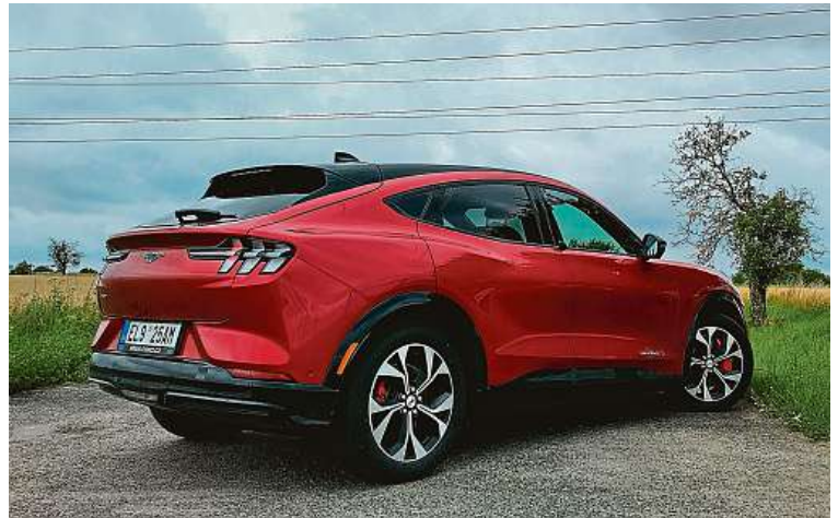
Kufř pojmě v základu přes 400 litrů, po složení sedadel až 1600.