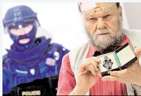
Věstonická venuše v laboratoři pod dohledem