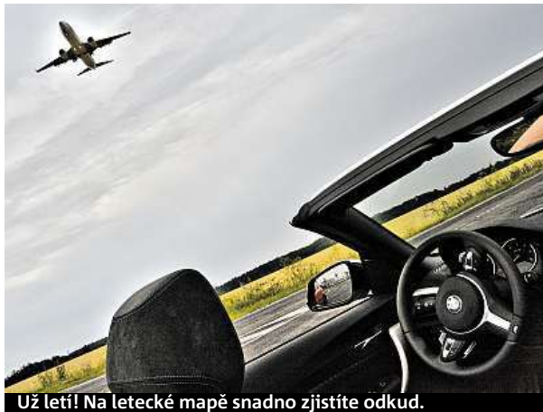
Už letí! Na letecké mapě snadno zjistíte odkud.