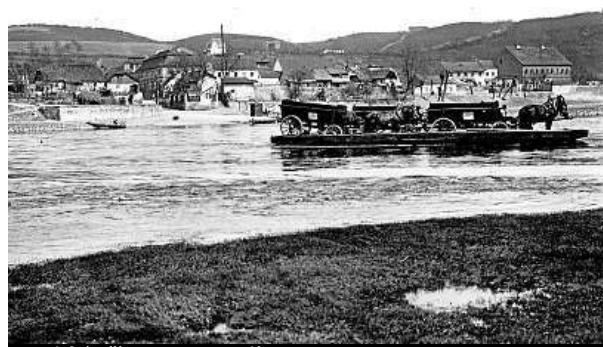
Trojský přívoz. Dnes stojí u zoo most.