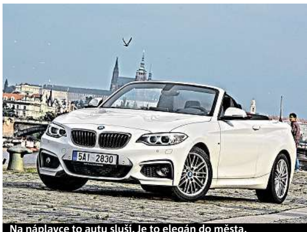
Na náplavce to autu sluší. Je to elegant do města.