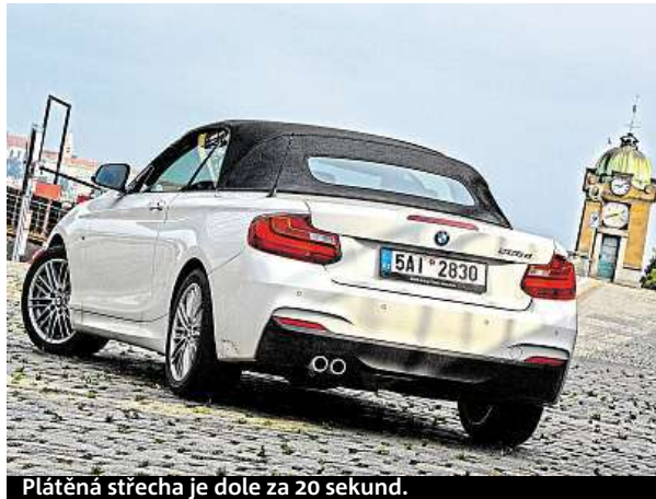
Plátěná střeška je dole za 20 sekund.