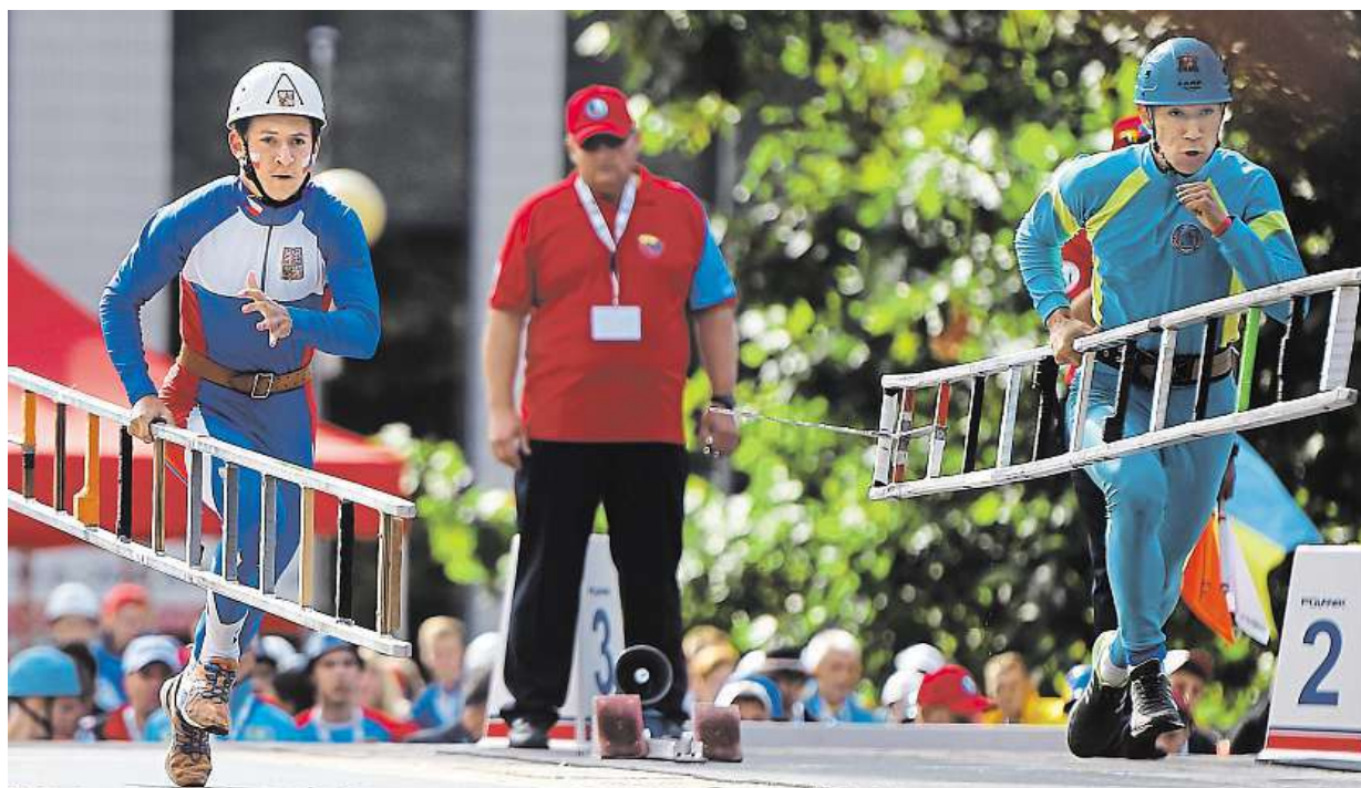
Hasiči z 15 zemí do soboty soutěží v Ostravě o titul mistrů světa v požárním sportu. První disciplínou byl výstup na cvičnou věž. ČTK

Dovolená na míru. Češi víc volí krátkodobé cesty v libovolných termínech. Nové trendy. Sestavte si zájezd zcela podle vlastních představ. Lákavé destinace na variabilní cesty. Vládnu Chorvatsko a Itálie STRANA 6