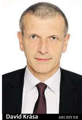
David Krása ARCHIV DK

V roce 2010 jsme jako nový prvek navrhli automatický dopravní systém – vlaky bez strojvedoucího. Pak prošel návrh několika úspornými změnami, lze říct až kotrmelci, ale nakonec platí původní návrh vlaků bez strojvedouce s oddělovacími bezpečnostními stěnami mezi nástupištěm a kolejí. Podobné systémy jsou dnes již běžné všude, kde staví novou nezávislou linku. Stanice budou stejně dlouhé jako na céčku, stejně vysoká nástupiště, stejně napájení. To umožní, aby třeba