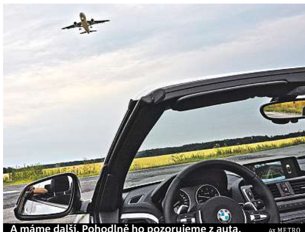
A máme další. Pohodlně ho pozorujeme z auta.