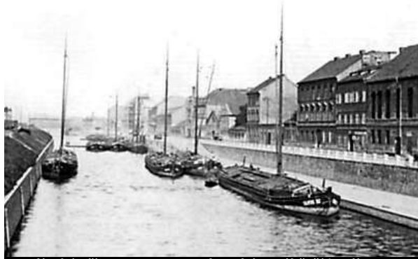
Karlínský přístav. Dnes po Rohanském nábřeží jezdí auta.