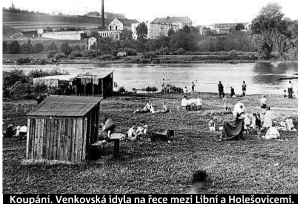
Koupání. Venkovská idyla na řece mezi Libní a Holešovicemi.

Zatímco 1. díl mapoval centrum a jih města, 2. díl Petřskou čtvrt, Karlín s Rohanským ostrovem, Maniny a přeložení koryta řeky, karlínský, libeňský a holešovický přístav a plavební průplav mezi Trojou a Bubenčí. ROW