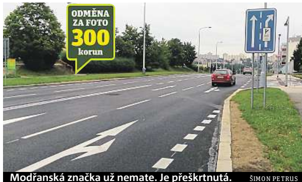
Modřanská značka už nemate. Je přeškrtnutá. ŠIMON PETRUS

„Svislé značení bývá nadřazené vodorovnému, proto by řidiči jedoucí přímo neměli projíždět pravým pruhem,“ řekl deníku Metro mluvčí Ropidu Filip Drápal, podle kterého chyboval projektant stavby. Zapomněl totiž značku