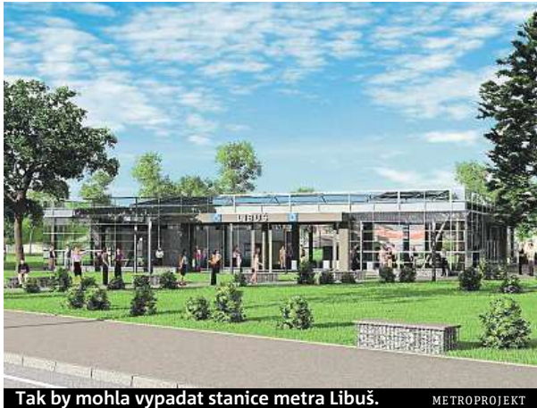
Tak by mohla vypadat stanice metra Libuš. METROPROJEKT

Nikde není řečeno, co je těžké a co lehké metro. Existují i systémy s větším profilem tunelů a těžšími vlaky než v Pra-