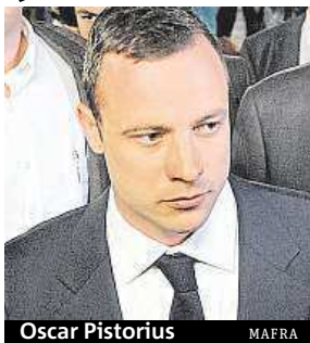
Oscar Pistorius MAFRA

Osmadvacetiletý Pistorius bude propuštěn tento týden. Podle agentury Reuters se přesune do třípodlažní vily na předměstí Pretorie, kde stráví zbytek pětiletého trestu ve formě domácího vězení