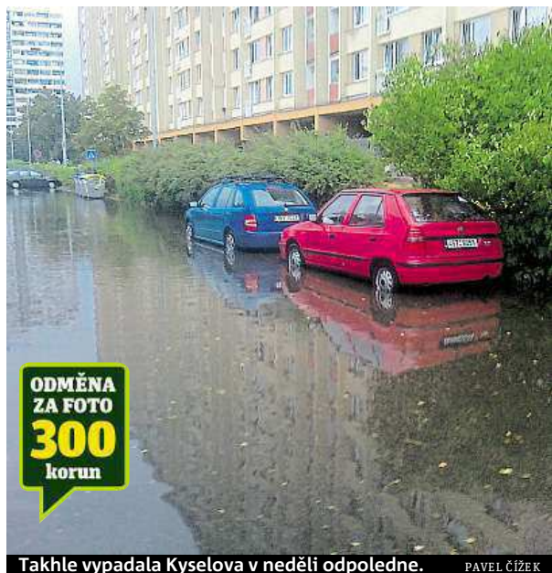
Takhle vypadala Kyselova v neděli odpoledne.