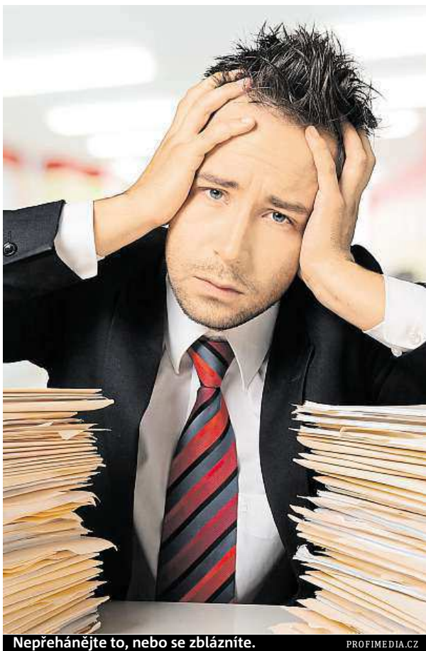
Nepřehánějte to, nebo se zblázníte.

Spousta lidí z obavy ze ztráty zaměstnání nedokáže říct „Ne“. To ale často vede k tomu, že jsou pak na vás kladeny stále větší nároky, které vám začnou přerůstat přes hlavu. Jste-li zahlceni svou prací, nemusíte mít pocit viny z toho, že kolegové odmítnete pomoci. „Důležité je vše důstojně vykomunikovat a najít adekvátní způsob řešení, který bude vyhovovat obě-