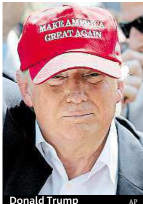
Donald Trump

Na otázku redaktora, zda chce deportovat i děti,