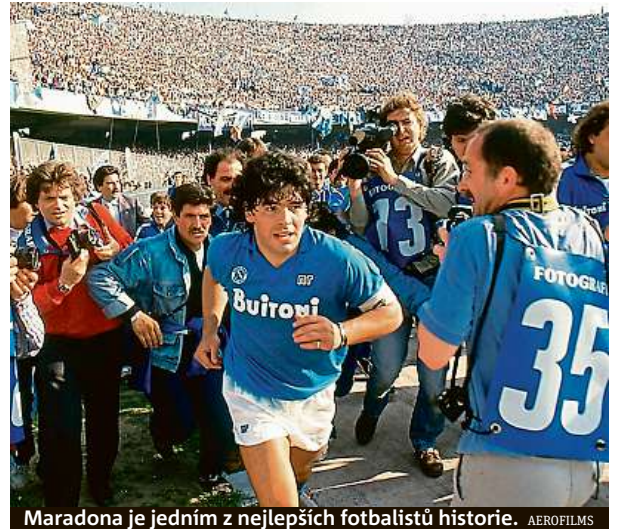
Maradona je jedním z nejlepších fotbalistů historie.

Hraný dokument o fotbalové legendě natočil oscarový režisér Asif Kapadia.