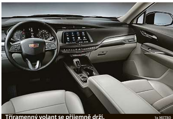
Třiramenný volant se příjemně drží.

K testu jsme dostali verzi pro kanadský trh, takže jsme si museli zvykat na levé zpětné zrcátko, které pořádně zvětšuje, dvojité odemykání dveří dálkovým ovladačem nebo to, že navigace neměla české mapy. To ale vem čert – potěšil nás motor, který je ovšem jediným v nabídce. Dvoulitrový benzínový čtyřválec s výkonem 238 koní má pěkný záťah, dobře spolupracuje s devítistupňovou automatickou převodovkou a přenáší 350 Nm na přední, nebo pokud chcete, na všech