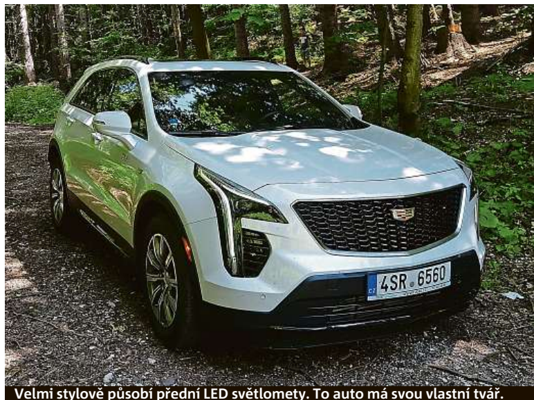
Velmi stylově působí přední LED světlomety. To auto má svou vlastní tvář.