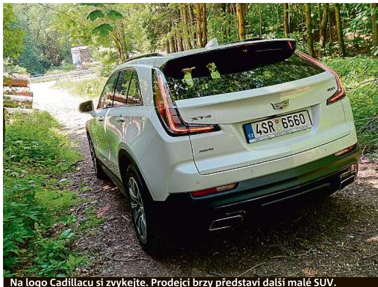
Na logo Cadillacu si zvykejte. Prodejci brzy představí další malé SUV.