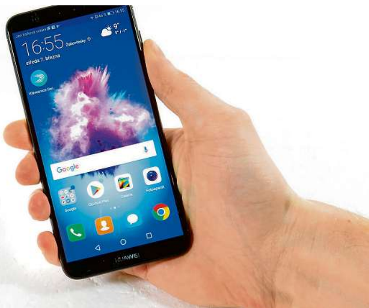
Celý telefon působí solidním dojmem.

Chytrý telefon Huawei P smart můžete pořídit hned v několika barvách v největším českém IT e-shopu Mironet za 5490 Kč. Jako dárek zde navíc získáte bezdrátový reproduktor Lamax Street ST-1 Beat v hodnotě 890 korun.