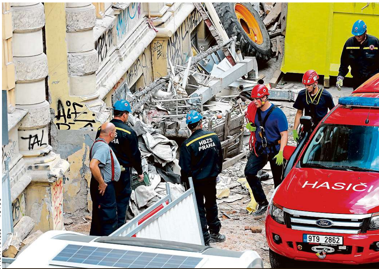
V rekonstruovaném domě v Mikulandské ulici v centru města se včera zřítla část budovy. Strop zavalil několik lidí. Více na straně 2.

Návštěvníké řády. Vyplatí se je prostudovat předem. Neponižujte stráž. Pražský hrad své vojáky předpisy chrání proti dotěrným turistům. Mazlíčci. Jsou většinou zakázáni, někde povolí malé zvíře v tašce STRANA 6