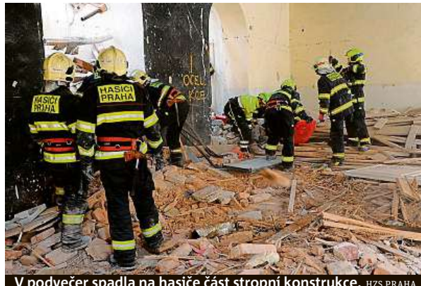
V podvečer spadla na hasiče část stropní konstrukce.

V objektu má vzniknout zázemí pro Vysokou školu uměleckoprůmyslovou (UMPRUM). Primátorka Adriana Krnáčová prohlásila, že Národní památkový ústav mož-