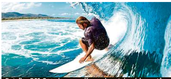
Dataflex DFS-Q305 je pro nadšence do extrémních sportů.

Akční kamery se v současnosti těší velké oblibě a není se čemu divit. Tyhle malé kamery v sobě kombinují skvělou kvalitou videa s vysokou odolností a malými rozměry. Díky tomu se perfektně hodí pro všechny nadšence do extrémních sportů, cyklistiky, potápění i jakýchkoliv jiných sportovních a outdoorových aktivit. Nejznámějším jménem mezi akčními kamerami je GoPro, ovšem tyto kamery stojí nemalé peníze. Proto se dnes podíváme na daleko dostupnější možnost – Dataflex DFS-Q305.