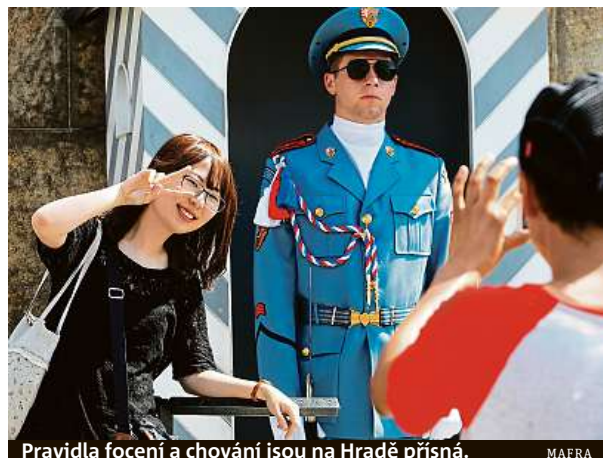
Pravidla focení a chování jsou na Hradě přísná.

V některých zámcích je stále zakázaný vstup v obuvi, na turisty čekají proslulé klouzavé papuče. Těmi chrání původní parkety, například na Červené Lhotě. Jinde ale přezouvání už zrušili. Zjistili totiž, že se na podrážky pantoflí lepší nečistoty a tahle vrstva pak působí jako brusná nebo být v tašce a je povolen jen jeden pes na skupinu. S mazlíčkem se můžete vydat je nenutí už od začátku devadesátých let. PAVEL HRABICA