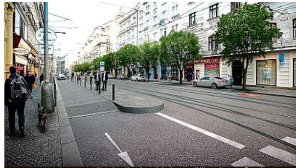
Na Strossmayerově náměstí má být rozšířený ostrůvek. IPR

„Nechápu, proč studie radou neprošla. Projednávalo se to dlouho se všemi zúčastněnými. Mrzí mě to o to víc, že žádné věcné námítky ne-