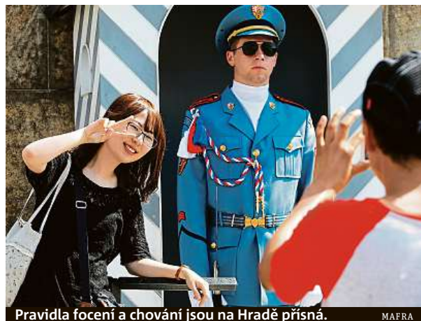
Pravidla focení a chování jsou na Hradě přísná.

V některých zámcích je stále zakázaný vstup v obuvi, na turisty čekají proslulé klouzavé papuče. Těmi chrání původní parkety, například na Červené Lhotě. Jinde ale přezouvání už zrušili. Zjistili totiž, že se na podrážky pantoflí lepší nečistoty a tahle vrstva pak působí jako brusná pasta a parkety spíš poškozují. Třeba v Českém Krumlově je nenutí už od začátku devadesátých let. PAVEL HRABICA