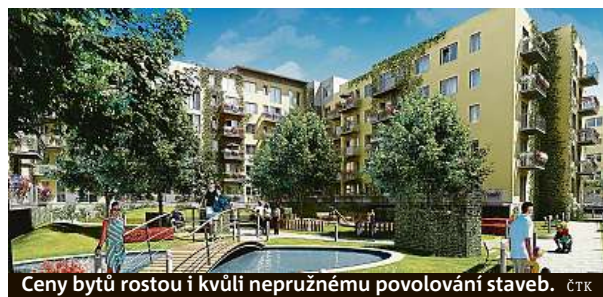
Ceny bytů rostou i kvůli nepružnému povolování staveb.

vzhůru zablokovaný proces povolování nových staveb, kvůli kterému je na trhu extrémní převis poptávky nad nabídkou. Nic na tom nezmění ani nedávno ohlášené další zprísňení podmínek pro poskytování hypoték ze strany ČNB. Tento nesystémový krok růst cen bytů nezastaví, ale bude mít zcela jiný dopad. Učiní více nedostupným vlastní bydlení pro všechny mladé zájemce a nažene je do područí nájemního bydlení,“ nastiňuje další vývoj Konec, podle kterého ceny nových bytů letos porostou ještě zhruba o pět procent. MET