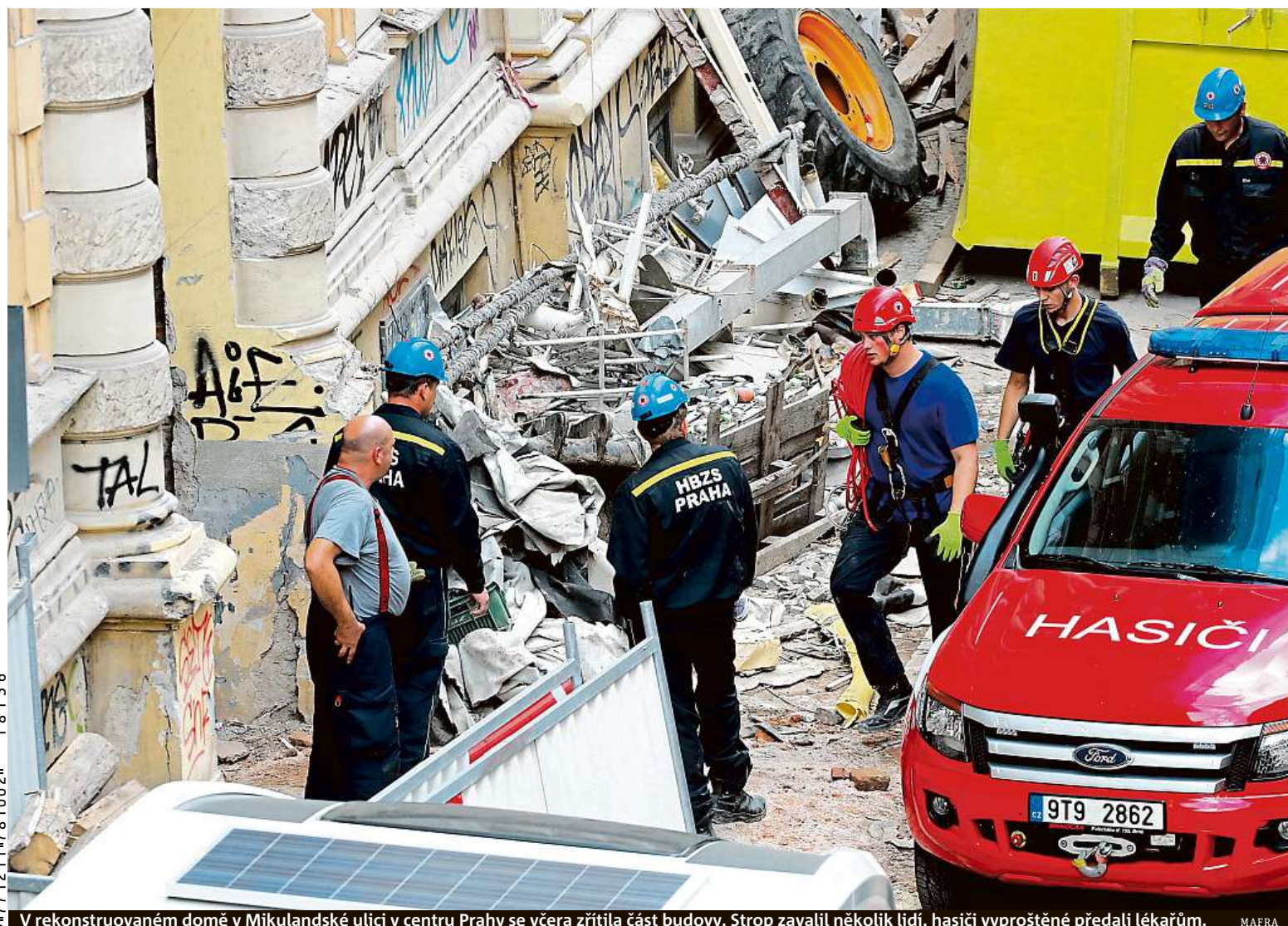
V rekonstruovaném domě v Mikulandské ulici v centru Prahy se večera zřítla část budovy. Strop zavalil několik lidí, hasiči vyproštěné předali lékařům. MAFRA

Návštěvníké řady. Vyplatí se je prostudovat předem. Neponižujte stráž. Pražský hrad své vojáky předpisy chrání proti dotěrným turistům. Mazlíčci. Jsou většinou zakázáni, někde povolí malé zvíře v tašce STRANA 4