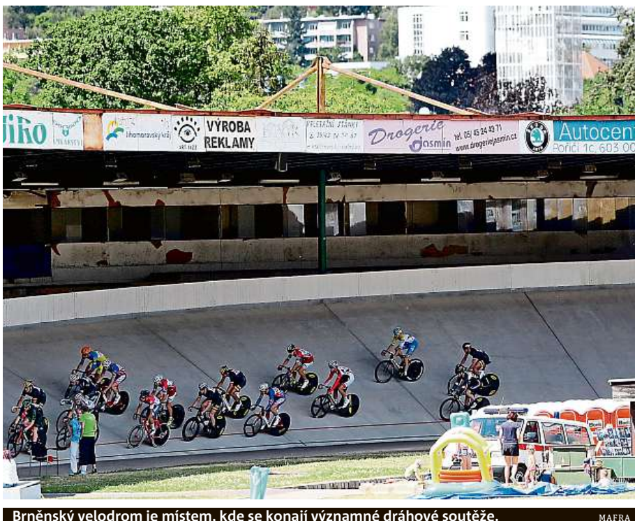
Brněnský velodrom je místem, kde se konají významné dráhové soutěže.

Firma Arch.Design podala nejnižší nabídkovou cenu. „Výstavba nového velodromu patří mezi strategické projekty města a radní udělali další krok k tomu, aby to bylo zrealizováno. Společnost Arch.Design už v roce 2008 vypracovala územní studii na lokalitu Hněvskovského. Všechna sportoviště, která byla ve studii zanesena, už