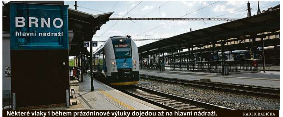
Některé vlaky i během prázdninové výluky dojedou až na hlavní nádraží.

„Na letní výluky kvůli opravám železničního uzlu si musí Brňané i ostatní cestující zvykat už čtvrtým rokem. Zatímco loni omezily na tři měsíce zhruba tři stovky spojů denně, letos je rozsah menší, co se objemu týče, ale zato budou práce trvat delší časové období. I letos jsme se snažili vymyslet takové dopravní