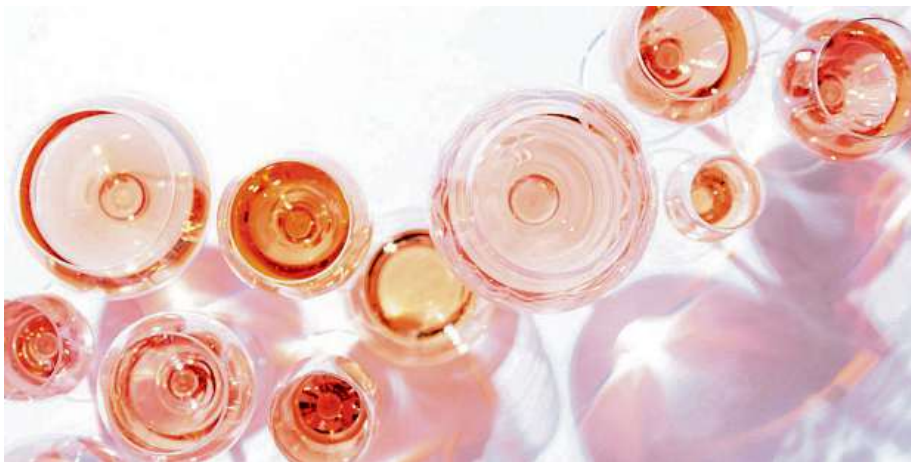
K popularitě přispěla obliba svatomartinského vína, třetina z nich jsou růžová.

Až do roku 2008 se produkce růžového vína nenevidovala, protože šlo o okrajový produkt. „Růžové víno jako takové je pro vinaře velkou výzvou, protože není vůbec jednoduché vyrobit rosé, které nejenže je kvalitní, ale také