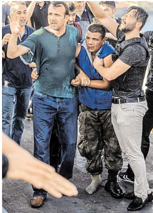
Dav vede vojáka (v bundě), který se podílel na převratu.

Už v sobotu úřady odvolaly z funkce 2745 soudců a státních zástupců z celkového počtu přibližně 15 tisíc. Tentýž den prezident Erdogan slíbil, že zničí paralelní struktury, které podle něj v justici, školství, médiích a armádě vybudoval duchovní Fethullah