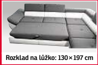
Rozklad na lůžko: 130 × 197 cm