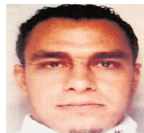
Mohamed Bouhleh AP

Při útoku bylo také zraněno asi 200 lidí. Pětaosmdesát z nich zůstává v nemocni-