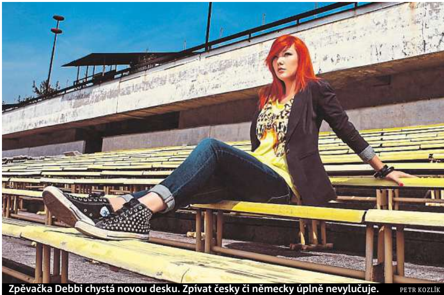
Zpěvačka Debbi chystá novou desku. Zpívat česky či německy úplně nevyklučuje.

Jako umím, ale nezní to tak dobře. Opravdu je to tak, že čeština je pro zpěv velmi náročná. A já nejsem rodilý Čech, a ačkoliv se to nemusí zdát, když mluvím, ve zpěvu to slyšet je. Je to jazyk, ve kterém jsou velmi slyšet chyby.