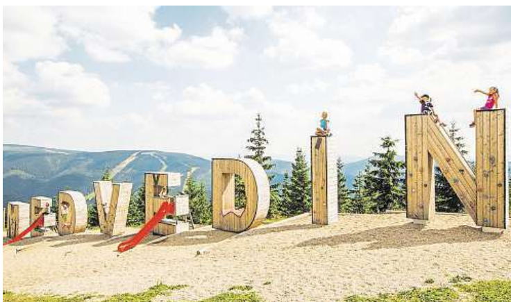
Na hory i v létě. Jinde se čerstvějšího vzduchu nenadýcháte. Zábavu tu najde každý.

Zajímavé novinky hlásí pro své návštěvníky „český Aspen“ – Špindlerův Mlýn. V místním skiareálu se zabavíte! Kromě adrenalinové dětské lanovky Sky Dive na Medvědíne letos nebudou ochuzeni ani cyklisté. Pod dohledem Michala Marošího vznikla ve Svatém Petru nová trať Špindl Bike Parku. Zablbnout si tady můžou jak ostřílení jezdci, tak i děti. „Bajk park“ nabízí více než 13 kilometrů tratí a stezek. „Downhillová trať má i lehčí variantu, aby byla přístupná i pro méně technicky zdatné jezdce. Ná-