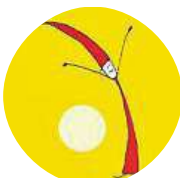
Merlin Irene Že jsem se každé ráno zase probudila do nového dne.