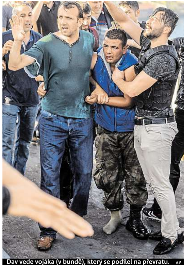
Dav vede vojáka (v bundě), který se podílel na převratu.

Už v sobotu úřady odvolaly z funkce 2745 soudců a státních zástupců z celkového počtu přibližně 15 tisíc. Tentýž den prezident Erdogan slíbil, že zničí paralelní struktury, které podle něj v justici, školství, médiích a armádě vybudoval duchovní Fethullah