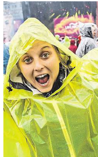
Letošní ročník zasáhl déšť.

Loni festival navštívilo víc než 43 000 lidí. Letos pořadatelé návštěvnost poprvé nezveřejnili. „Počet diváků není měřítko pro kvalitu festivalu. Nechceme podléhat honu na rekordy. Myslím, že máme dost silnou pozici, abychom se přestali zabývat tím, kolik tady bylo lidí. Důležitější je kvalita, co všechno nabízíme. A proto ani do budoucna nebudeme čísla zveřejňovat,“ zdůvodnila. Připustila, že dů-