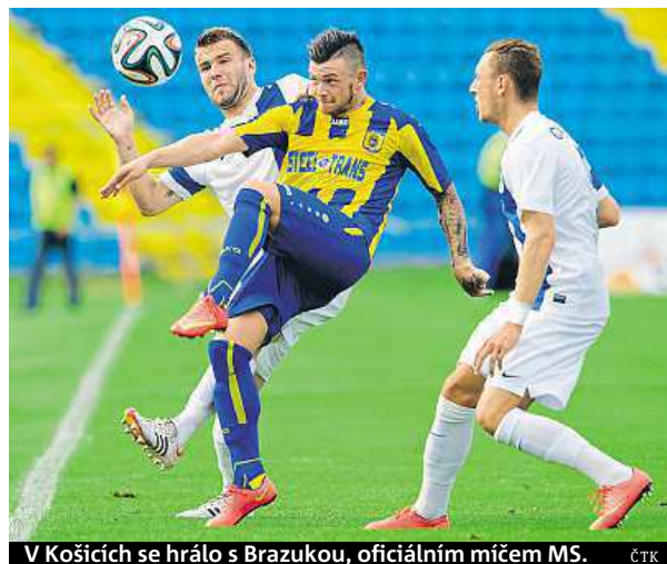
V Košicích se hrálo s Brazukou, oficiálním míčem MS.