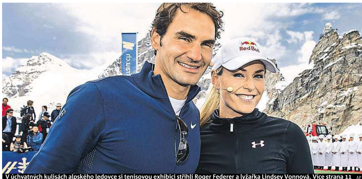
V úchvatných kulisách alpského ledovce si tenisovou exhibicí střihli Roger Federer a lyžařka Lindsey Vonnová. Více strana 11

Katastrofa. Na Ukrajině blízko hranic s Ruskem se zřítilo malajsijské dopravní letadlo. Pád nikdo nepřežil. Na palubě bylo 295 lidí. Kyjev a proruští povstalci. Vzájemně se obviňují, že stroj sestřelila druhá strana STRANA 4