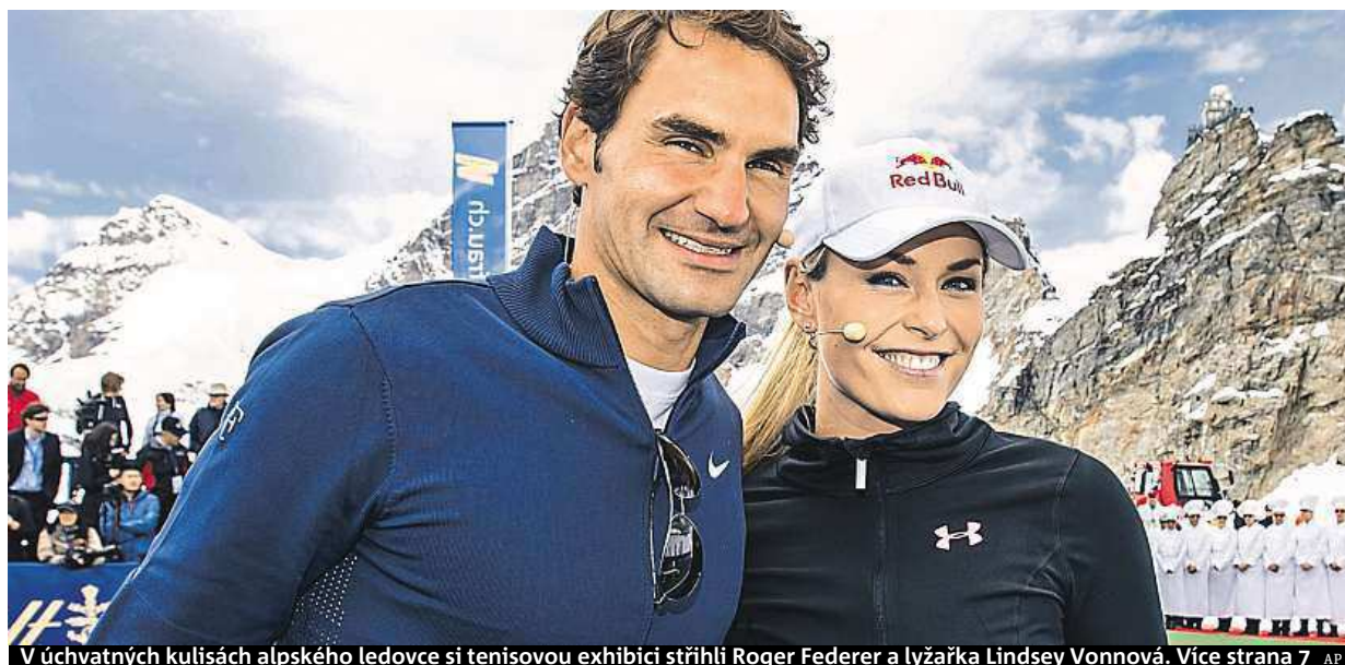
V úchvatných kulisách alpského ledovce si tenisovou exhibicí střihli Roger Federer a lyžařka Lindsey Vonnová. Více strana 7

Katastrofa. Na Ukrajině blízko hranic s Ruskem se zřítilo malajsijské dopravní letadlo. Pád nikdo nepřežil. Na palubě bylo 295 lidí. Kyjev a proruští povstalci. Vzájemně se obviňují, že stroj sestřelila druhá strana STRANA 4