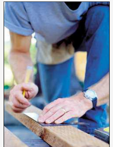
ČMSS vám díky svému VIP servisu pomůže i s výběrem řemeslníků.