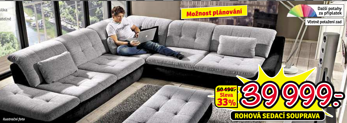
Lůžko za příplatek