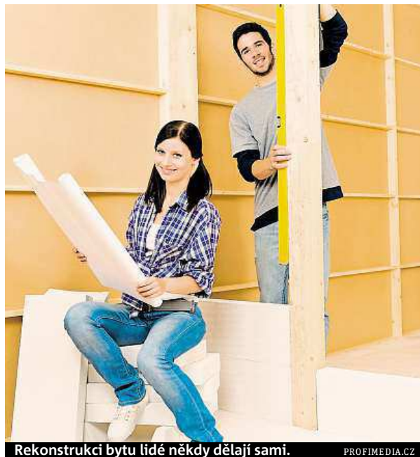
Rekonstrukci bytu lidé někdy dělají sami.