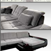
Úložný prostor za příplatek

Rohová sedací souprava, korpus žinilka černá / sedák žinilka šedá, nohy kov chrom, 251×87×308 cm, plně polohovatelné opěrky zad a hlavy, polštář za příplatek, 1004671-50 **