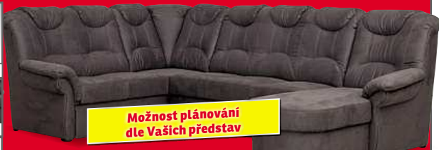
Rozkládací na lůžko 120×250 cm za příplatek