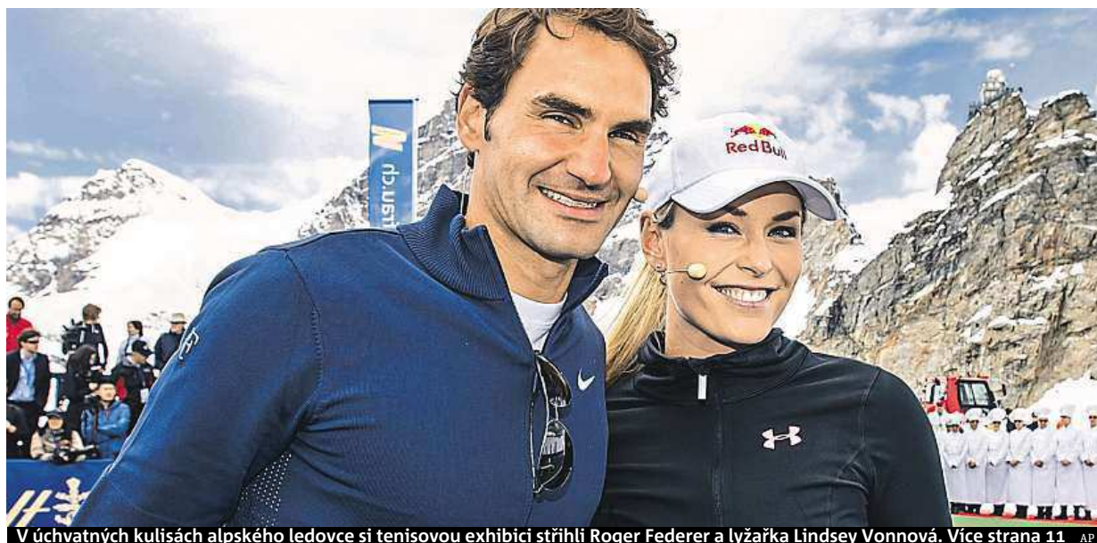
V úchvatných kulisách alpského ledovce si tenisovou exhibici střihli Roger Federer a lyžařka Lindsey Vonnová. Více strana 11

Katastrofa. Na Ukrajině blízko hranic s Ruskem se zřítilo malajsijské dopravní letadlo. Pád nikdo nepřežil. Na palubě bylo 295 lidí. Kyjev a proruští povstalci. Vzájemně se obviňují, že stroj sestřelila druhá strana STRANA 4