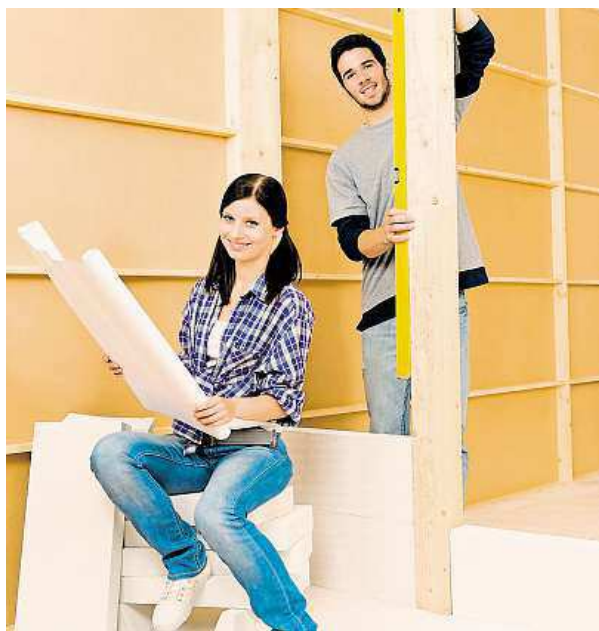
Rekonstrukci bytu lidé někdy dělají sami.