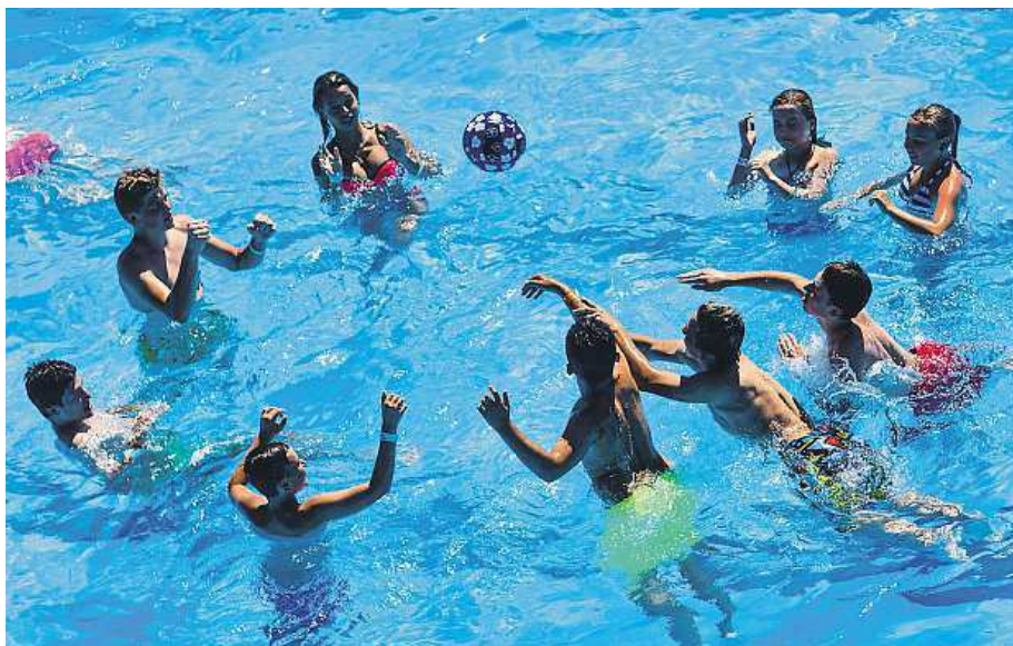
Než skočíte do studené vody, osprchujte se vlažnou. Chráníte tak své zdraví.

Rizik spojených s horky a suchem je ale víc. Kromě požárů jsou to třeba úžehy. Je proto nutné dodržovat pitný režim, pro ten však není vhodný alkohol. V horku to-