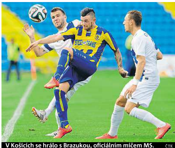
V Košicích se hrálo s Brazukou, oficiálním míčem MS. ČTK

Zápas Mladé Boleslavi proti týmu Široki Brijeg skončil po uzávěrce tohoto vydání. STK