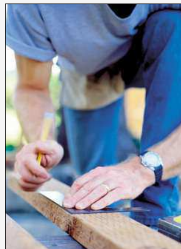
ČMSS vám díky svému VIP servisu pomůže i s výběrem řemeslníků.