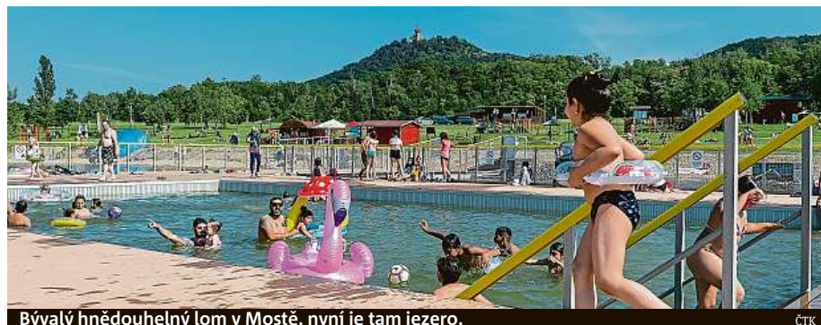
Bývalý hnědouhelný lom v Mostě, nyní je tam jezero.