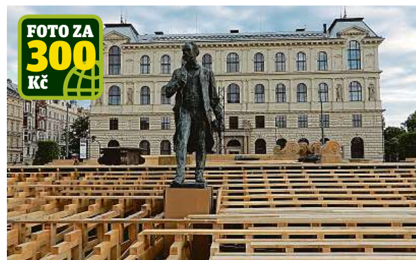
Příprava filmové kašny na náměstí Jana Palacha