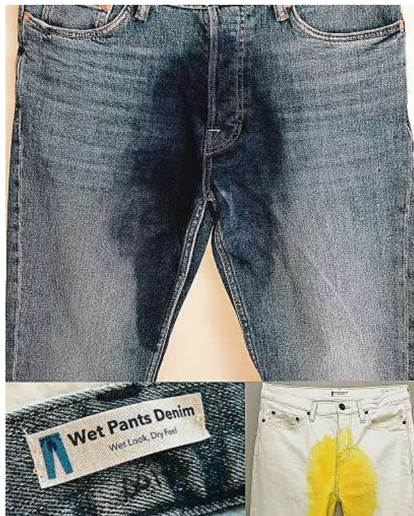
Na výběr je ze tří variant.