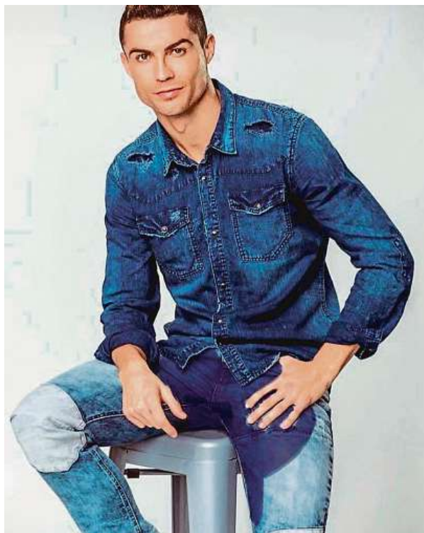
Pomočené džíny oblékl díky fotomontáži i Ronaldo.

„Pokud se však na trend díváme se vši vážností, můžeme si tento komický produkt spojit s trendem homeless chic, nepřímou navazujícím na devadesátkový grunge, zpopularizovaný v ulicích díky Kurtu Cobainovi a na mole díky Marku Jacobsovi. Grunge se po svém úpadku v roce 1994 opět vrátil díky vzkříšení vintage a ugly pouliční i vysoké módě. Za posledních několik let jsme jej