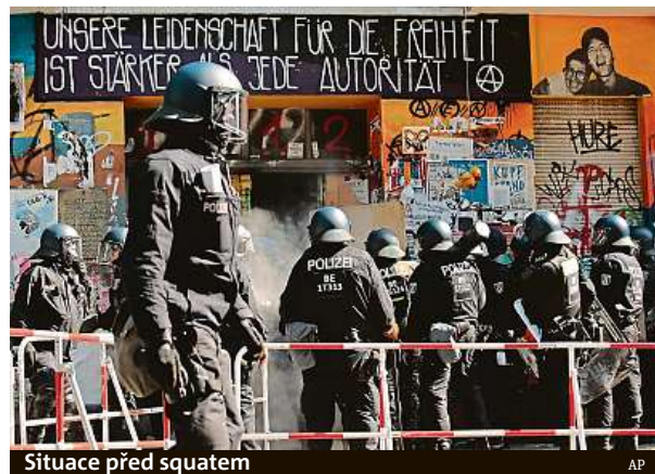
Situace před squatem

Německá policie včera dopoledne násilím vnikla do problematického berlínského squatu Rigaer 94 kvůli požární inspekci. Zabarikádování obyvatel jí v tom chtěli zabránit a na zasahující policisty zaútočili.