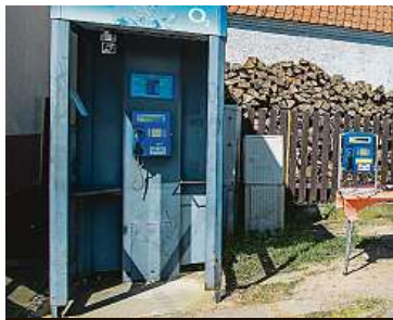
Dělníci odstranili poslední telefonní budku v zemi.

ly jako takzvané knihobudky. Ještě loni bylo v ČR 1150 budek. Ke konci roku přestaly fungovat přístroje a operátor je postupně demontoval. Úplně naposledy přišel na řadu veřejný automat v Hlubyni. Podle starosty Petra Boukala obec se 150 obyvateli poslední budka proslavila. „Jezdila se sem spousta lidí fotit s poslední telefonní budkou,“ řekl Boukal. O zachování alespoň v podobě knihobudky podle něj nebyl zájem. Obec ale uvazuje o tom, že by na místě poslední budky instalovala pamětní desku. Mohl by tak vzniknout zajímavý turistický cíl. ČTK