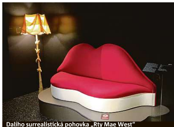
Dalího surrealistická pohovka „Rty Mae West“