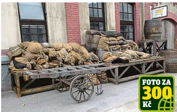
Přístav vzniká v prostorách Pražské tržnice.