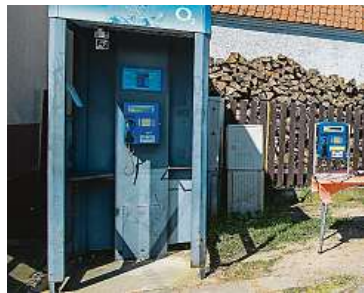
Dělníci odstranili poslední telefonní budku v zemi.