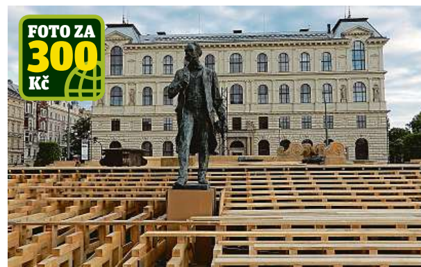
Příprava filmové kašny na náměstí Jana Palacha