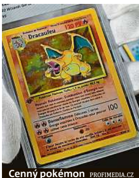
Cenný pokémon