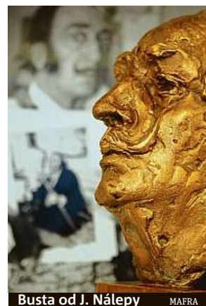
Busta od J. Nálepy