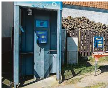
Dělníci odstranili poslední telefonní budku v zemi.

ly jako takzvané knihobudky. Ještě loni bylo v ČR 1150 budek. Ke konci roku přestaly fungovat přístroje a operátor je postupně demontoval. Úplně naposledy přišel na řadu veřejný automat v Hlubyni. Podle starosty Petra Boukala obec se 150 obyvateli poslední budka proslavila. „Jezdila se sem spousta lidí fotit s poslední telefonní budkou,“ řekl Boukal. O zachování alespoň v podobě knihobudky podle něj nebyl zájem. Obec ale uvažuje o tom, že by na místě poslední budky instalovala pamětní desku. Mohl by tak vzniknout zajímavý turistický cíl. ČTK