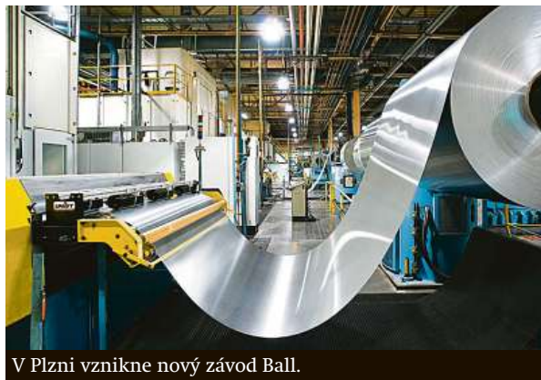
V Plzni vznikne nový závod Ball.

hliník je donekonečna recyklovatelnou surovinou, a tak se