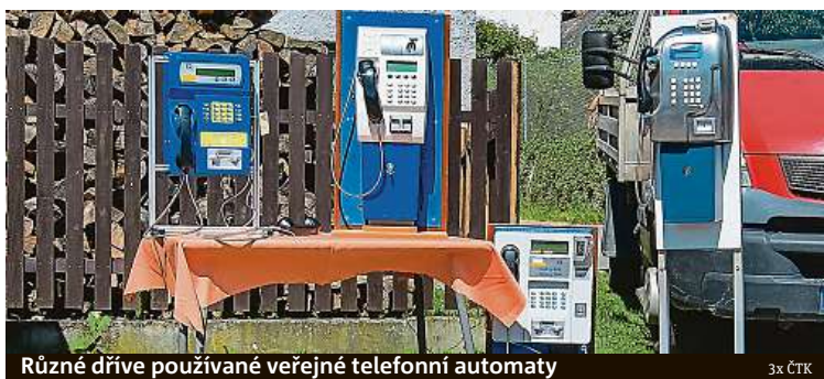
Různé dřevo používané veřejné telefonní automaty