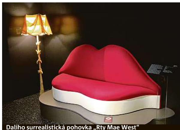
Dalího surrealistická pohovka „Rty Mae West“