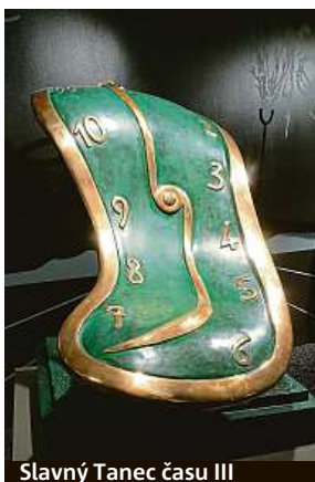
Slavný Tanec času III