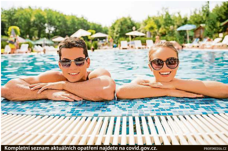
Kompletní seznam aktuálních opatření najdete na covid.gov.cz .

Možností, kde sledovat fotbalový svátek, je ale v metropoli víc. Namátkou: střecha pražského obchodního domu Harfa, dvůr Smíchovského pivovaru nebo například Chaberská Pergola. Pochopitelně se promítání pod širým nebem odehraje všude po Česku. Například fotbalový tým Sparta Kutná Hora zve fanoušky ke sledování přímo na svůj stadion.