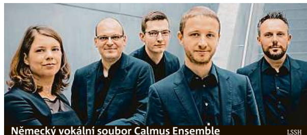
Německý vokální soubor Calmus Ensemble

francouzských pěvců uzavře 22. ročník Letních slavností staré hudby novodobou světovou premiérou divertissement Le Retour des dieux sur la terre Françoise Colina de Blamont, složeného pro francouzský královský dvůr. MET