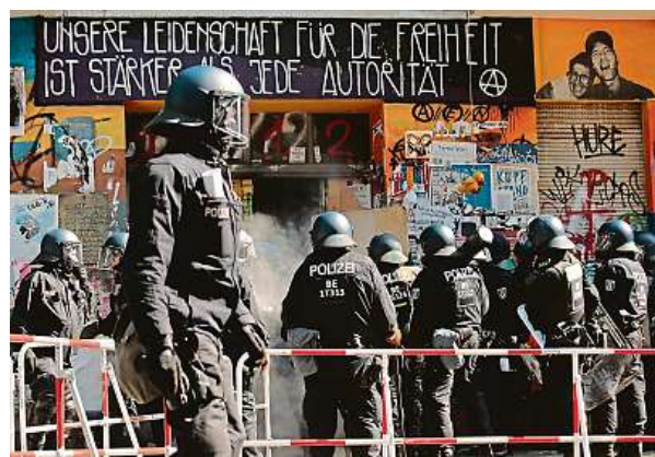
Situace před squatem

Německá policie včera dopoledne násilím vnikla do problematického berlínského squatu Rigaer 94 kvůli požární inspekci. Zabarikádování obyvatel jí v tom chtěli zabránit a na zasahující policisty zaútočili.