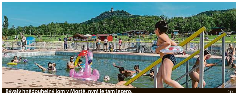
Bývalý hnědouhelný lom v Mostě, nyní je tam jezero.