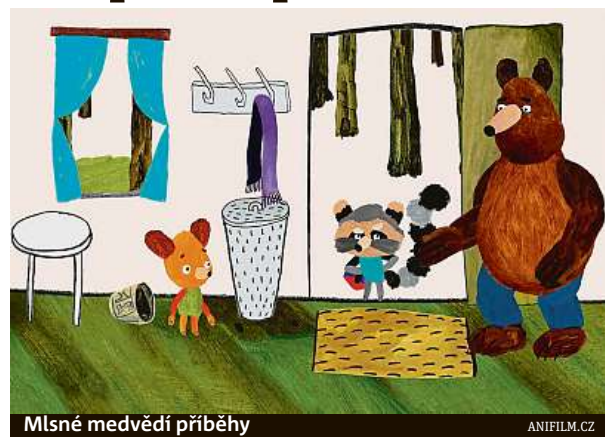
Mlsné medvědí příběhy

Více informací o festivalu i kompletním programu najdete na www.anifilm.cz . MET