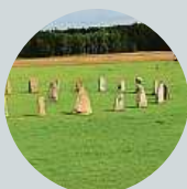
Radim Smith Samozřejmě ano, také díky spolupráci s Čínou a Indií.