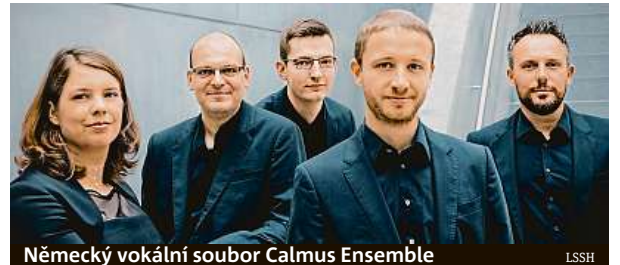
Německý vokální soubor Calmus Ensemble

francouzských pěvců uzavře 22. ročník Letních slavností staré hudby novodobou světovou premiérou divertissement Le Retour des dieux sur la terre Françoise Colina de Blamont, složeného pro francouzský královský dvůr. MET