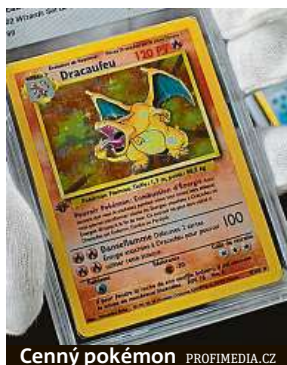
Cenný pokémon