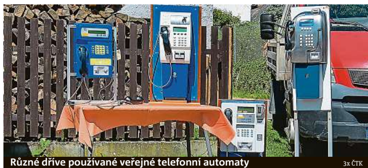
Různé dřevo používané veřejné telefonní automaty