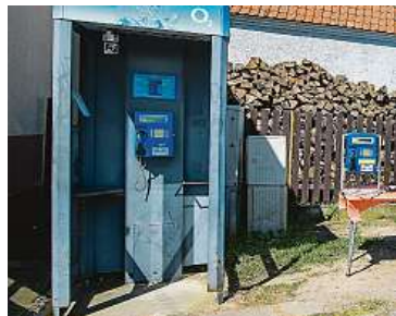
Dělníci odstranili poslední telefonní budku v zemi.