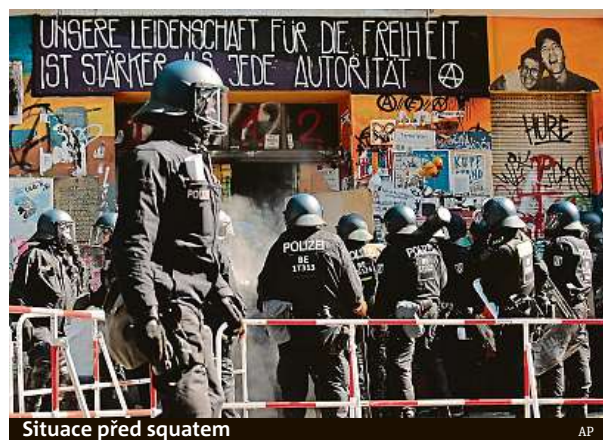
Situace před squatem

Německá policie včera dopoledne násilím vnikla do problematického berlínského squatu Rigaer 94 kvůli požární inspekci. Zabarikádování obyvatel jí v tom chtěli zabránit a na zasahující policisty zaútočili.