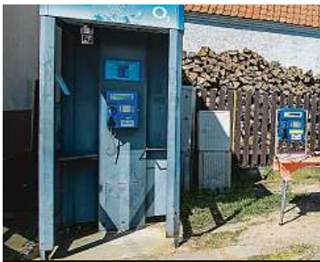
Dělníci odstranili poslední telefonní budku v zemi.