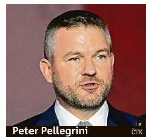
Peter Pellegrini

Pellegrini už dříve vyběhl Fica, dosud jediného předsedu Směru-SD od jeho založení v roce 1999, k odchodu z čela strany. Minulý týden pak oznámil odchod ze Směru-SD. Podle dostupných informací mu sice Fico nabídl funkci předsedy strany, ale pod podmínkou, že si pone-