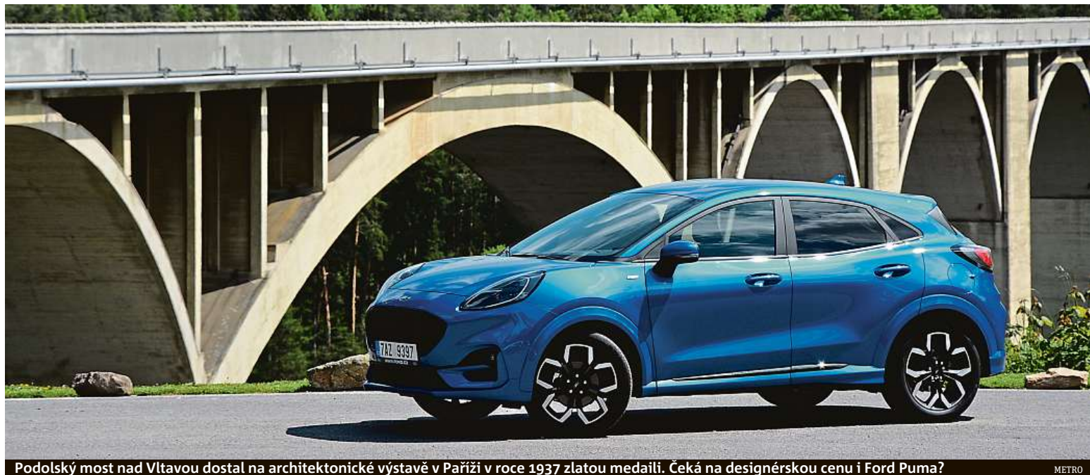
Podolský most nad Vltavou dostal na architektonické výstavě v Paříži v roce 1937 zlatou medaili. Čeká na designérskou cenu i Ford Puma?