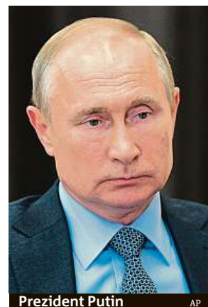
Prezident Putin

Rusko je nyní třetí zemí nejvíce zasaženou nemocí covid-19.