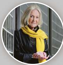
AI • DESIGN & ARUP

Zajímá Vás, jak návrh projektu Evy Jiříčné vypadá a které další návrhy v mezinárodní soutěži porotu zaujaly? Přijďte se podívat zítra 19. června mezi 13:00 – 17:30 hod. do Galerie Café Louvre, Národní 1987/22, Praha 1. Vstupné je zdarma.