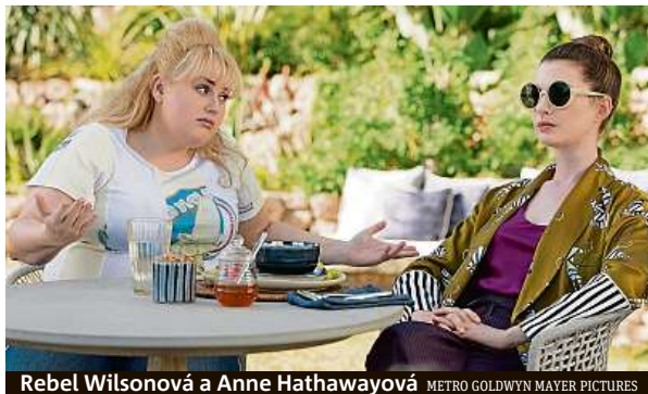
Rebel Wilsonová a Anne Hathawayová

Že není radno ženské pokolení podceňovat, názorně předvede dvojice opravdových profesionálních podvodnic. I přes počáteční rozpaky se po náhodném setkání ve vlaku ujme profesionálka, kterou hraje Anne Hathawayová, výcviku své méně talentované a méně sofistikované kolegyně. S obrovským úsilím, po řadě neuvěřitelných situací a zážitků, se z amatérky stává sice nekonvenční, ale všehoschopná kolegyně,