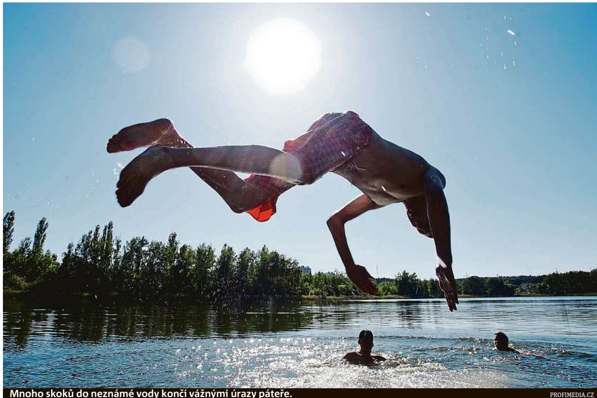
Mnoho skoků do neznámé vody končí vážnými úrazy páteře.

Poštípání hmyzem většinou není spojeno se závažnou kožní reakcí a stejně jako při bodnutí vosou stačí promazání místa vpichu mastí s protialergickým účinn