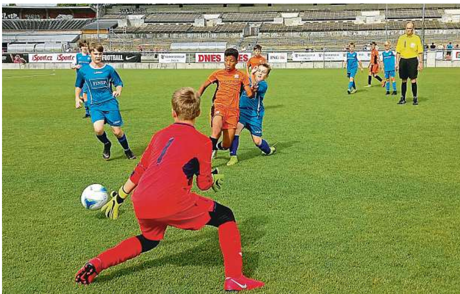
INGBohemia Soccer Cupu se zúčastnily desítky fotbalových týmů z celé republiky.

K vidění byly jak čistě klubovské týmy, tak i ty kombinované s dívkami, a to z Prahy, tak i mnoha míst z Česka. Přijely týmy například z Děčína, Karlových Varů, Brna-Židenic, Rakovníka, Kladna, Tábora a dalších velkých i malých měst, které se utkaly v šesti věkových kategoriích. „Neorganizujeme tento pohár za každou cenu jako soutěž, kde je to nejdůležitější získat trofej. Chceme spíš dětem dát příležitost zahrát si po sezoně