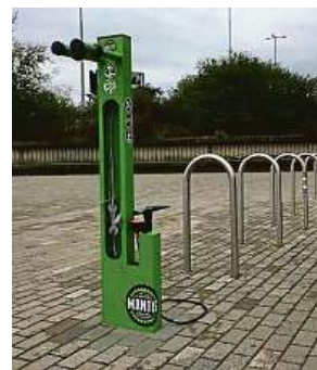
Stojan na Vltavské FACEBOOK

Zlatá horečka se rozpoutala v Galerii Myšák v ulici Vodičkova. VE ZLATNICTVÍ SHERRI VYKUPUJÍ ZLATO MIMOŘÁDNĚ VÝHODNĚ.