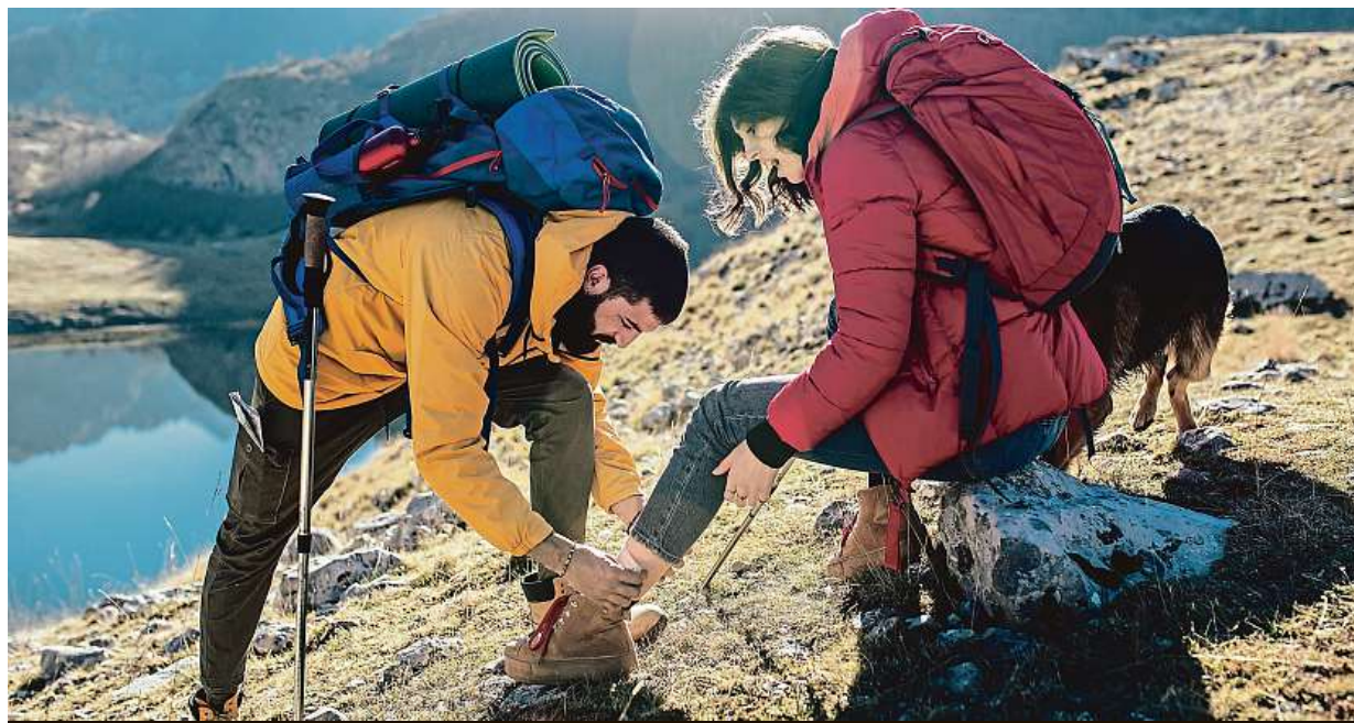
Na túry či výlety je vhodné nosit s sebou lékárničku.

Určitě nezapomínat na dezinfekční prostředky k vyčištění drobných ran či oděrek na kůži, aby se zabránilo vniknutí infekce do těla. Dále repelenty, náplasti a obvazy, sportovcům doporučuji také obinadlo pro případ pohmoždění nebo vyvrtnutí kloubů. Protože mezi nejčastější potíže patří obtíže zažívací, je dobré mít s sebou například živočišné uhlí, preventivně je možné užívat také probiotika, případně po konzultaci se svým lékařem při cestě do exotiky zvážit vypsání léků na předpis. Na dovolené se ale nemusíme vyhýbat ani nachlazení, a proto je dobré mít s sebou teploměr, léky ke sražení teploty či obecně proti bolesti. V neposlední řadě je nezbytné vzít si s sebou také léky, které užíváte pravidelně. KAMILA HUDEČKOVÁ