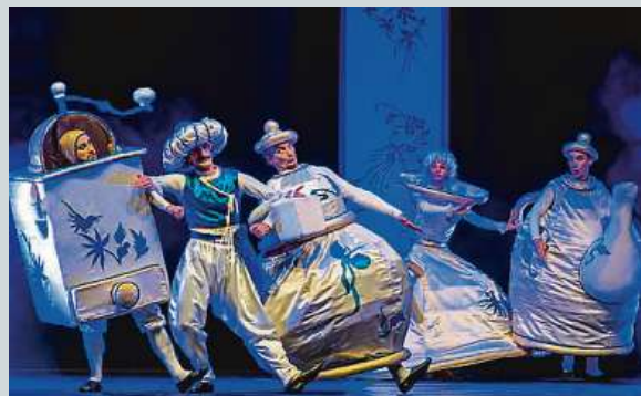
V Praze uvidíte Balet o bílé kávě.