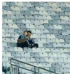
Duel Uruguay–Ekvádor

„Dělá nám to starosti. Ale myslím, že se to v průběhu turnaje zlepší,“ uvedl prezident pořádatel organizace CONMEBOL Alejandro Domínguez. Podle médií jsou na vině ceny vstupenek. Nejlevnější stojí v přepočtu 30 dolarů (téměř 700 korun). ČTK