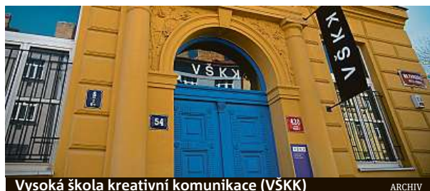
Vysoká škola kreativní komunikace (VŠKK)

Brzy mohou automatizované systémy nahradit až 30 procent lidské pracovní síly. Lidskou kreativitu zatím žádný stroj nenahradil. VŠKK vychovává profesionály, kteří v dnešním světě existují.