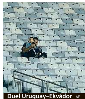
Duel Uruguay–Ekvádor AP

„Dělá nám to starosti. Ale myslím, že se to v průběhu turnaje zlepší,“ uvedl prezident pořádatel organizace CONMEBOL Alejandro Domínguez. Podle médií jsou na vině ceny vstupenek. Nejlevnější stojí v přepočtu 30 dolarů (téměř 700 korun). ČTK